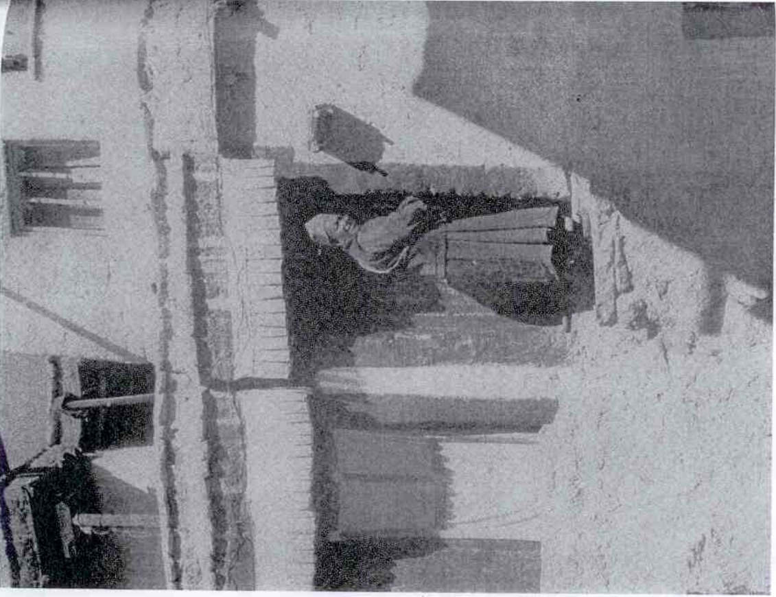
Mnich v klóštere Shankev u Lěhu