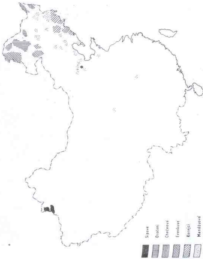
Sipoj Oročoni Čečeoové Evenkové Korejci Mandžuoové

Svým celkovým počtem 1,6 mil. obyvatel (v roce 1978) stojí KOREJCI (čínsky Čchao-sien-cu) na desátém místě mezi ostatními národnostmi národy CLR. Žijí ponejvíce ve východní části provincie Ti-lin, sousedící jak s KLDŘ, tak se SSSR, kde mají také svůj vlastní