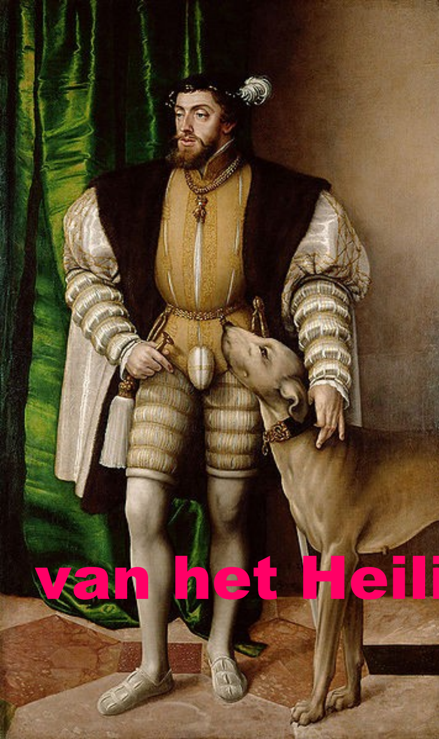
Karel V van het Heilige Roomse Rijk “Keizer Karel”