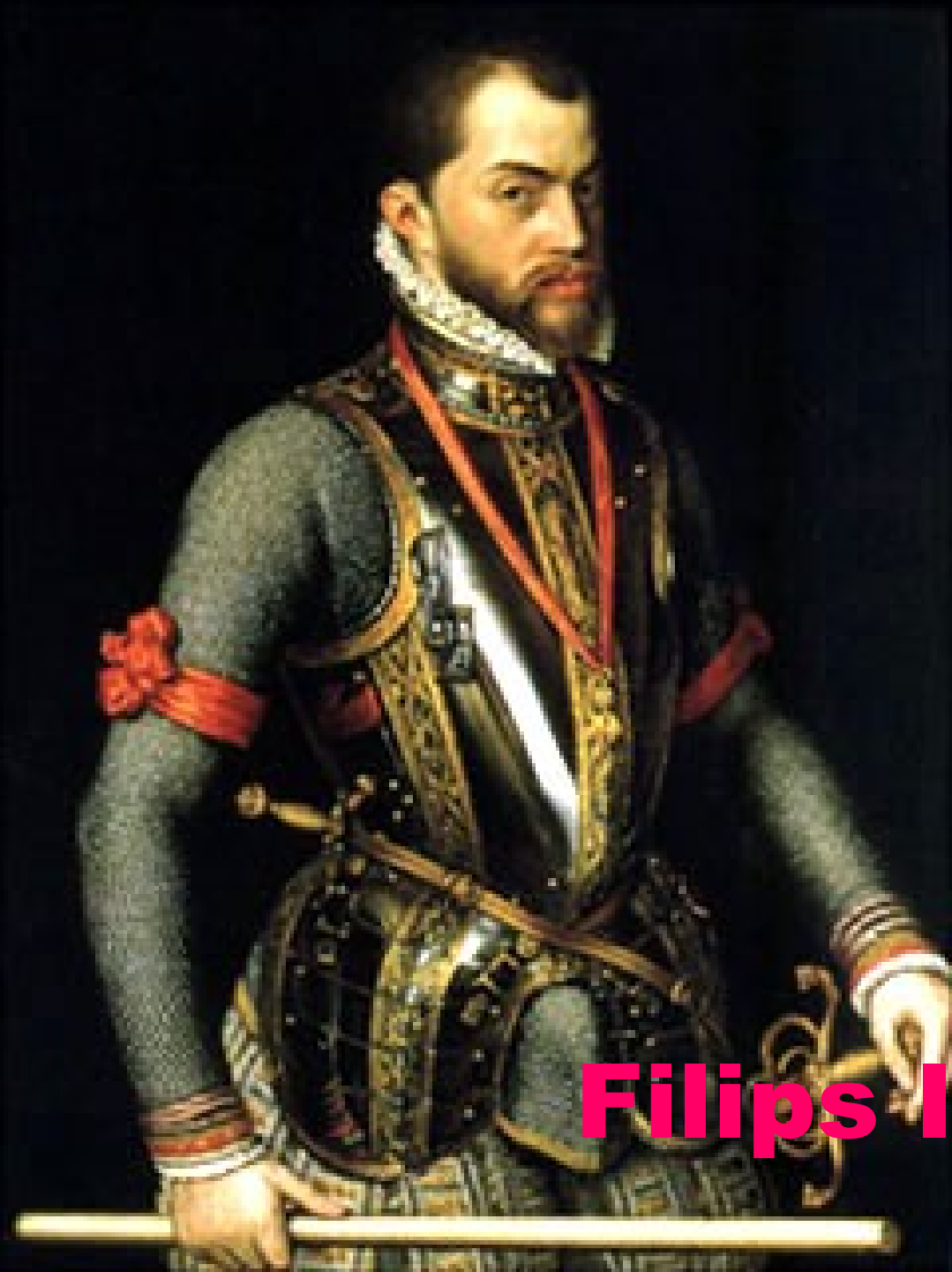
Filips II van Spanje