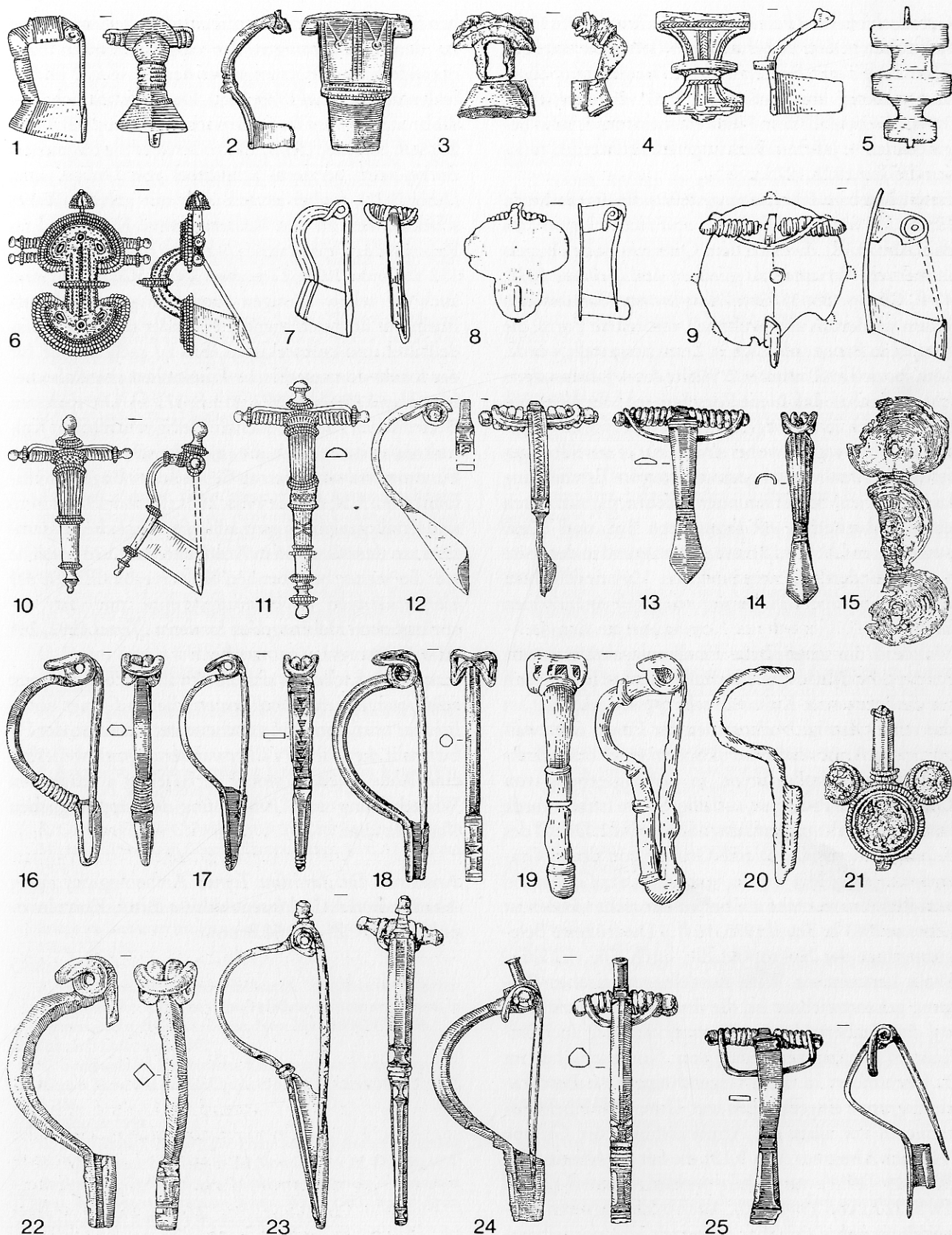
Abb. 3: Fibeln der jüngeren römischen Kaiserzeit (1–5 aus der Phase B 2/C 1): 1 Abrahám, Grab 85; 2 Chrlice, Siedlungsfund; 3 Mušov-Burgstall, röm. Festung; 4 Čáčov, Grab; 5 Iža, Leányvár, röm. Kastell; 6.10–11 Stráž, Grab II; 7.9.19.20 Očkov, Grab 174, zerstörte Gräber, Grab 197, 237, 117; 12.13.15.16.22–25 Kostelec, na Hané, Grab 308, 184, 201, 1, 295, 55, 169, 205; 17 Blažovice, Siedlungsfund; 14 ohne Angabe; 18 Minín; 21 Určice, Grab. M. 2:3