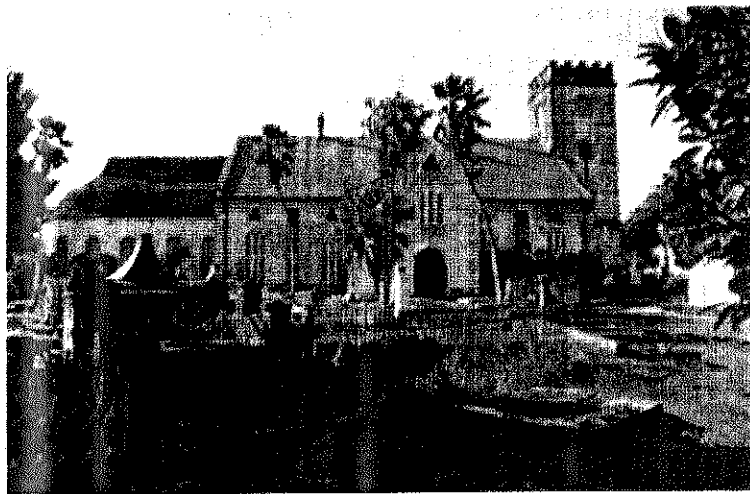
Ο αγγλικανικός καθεδρικός ναός του Αγίου Μιχαήλ, στην Μπρίτζταουν, πρωτεύουσα του νησιωτικού κράτους Μπαρμπάντος.

Μπρίτζταουν (Bridgetown): πόλη των Δυτικών Ινδιών, πρωτεύουσα και μοναδικό λιμάνι του νησιωτικού κράτους Μπαρμπάντος. Βρίσκεται στο νοτιοδυτικό άκρο του νησιού, στον Όρμο Κάρλαϊλ. Ιδρύθηκε το 1628 και αρχικά ονομαζόταν Ίντιαν Μπριτζ. Στα αξιοθέατά της ανήκουν ο αγγλικανικός καθεδρικός ναός του Αγίου Μιχαήλ, χτισμένος το 1780 από κορβαλλιογενή πέτρα, το Κυβερνητικό