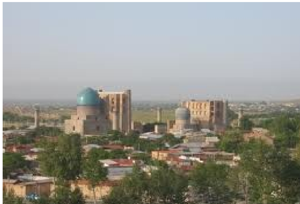
Mezquita Bibi Khanum