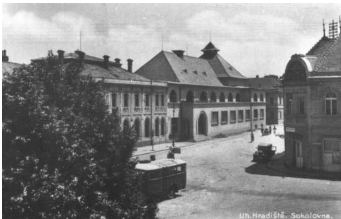
Obr. 2 – Divadlo staré na místě Sokolovny