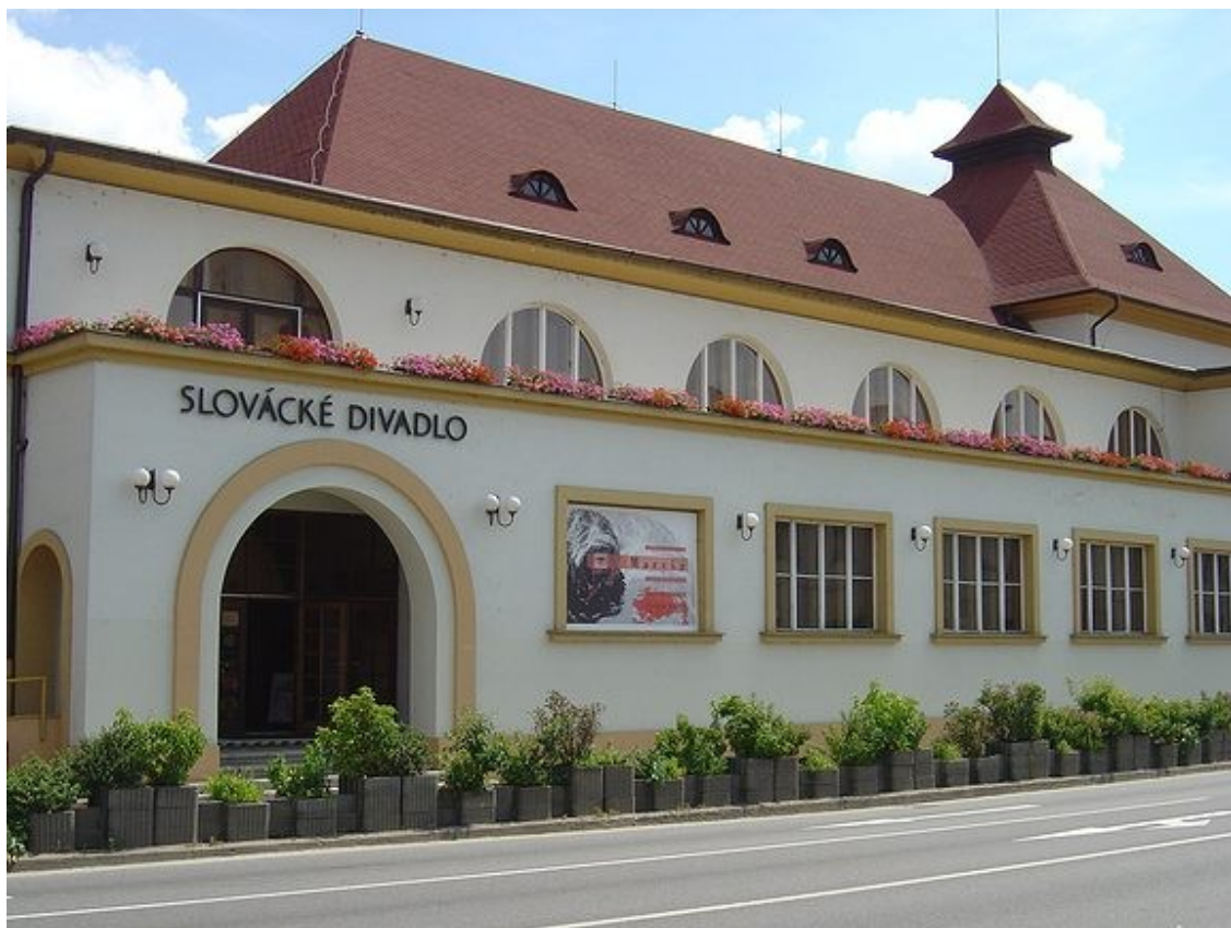
Obr. 1 – Slováké divadlo dnes (nové)