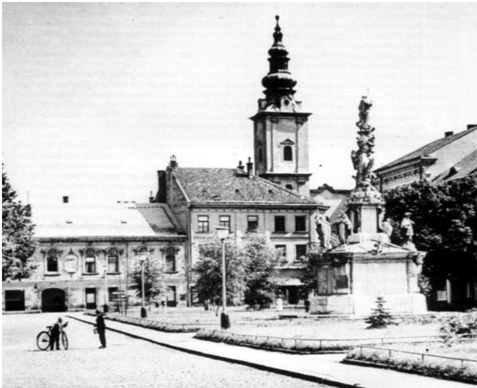
Obr. 3 – Nalevo hostinec, kde dnes stojí divadlo