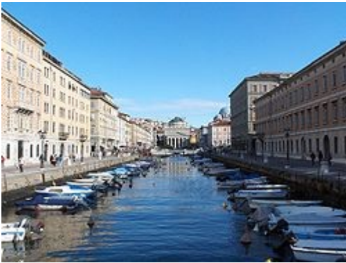
Il Canal Grande e Ponterosso (da lontano)