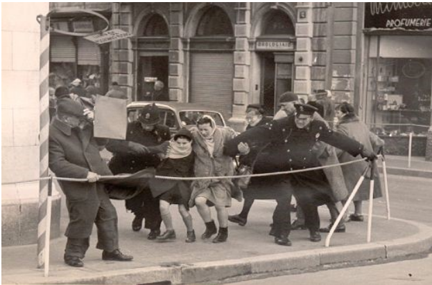
La bora a Trieste!