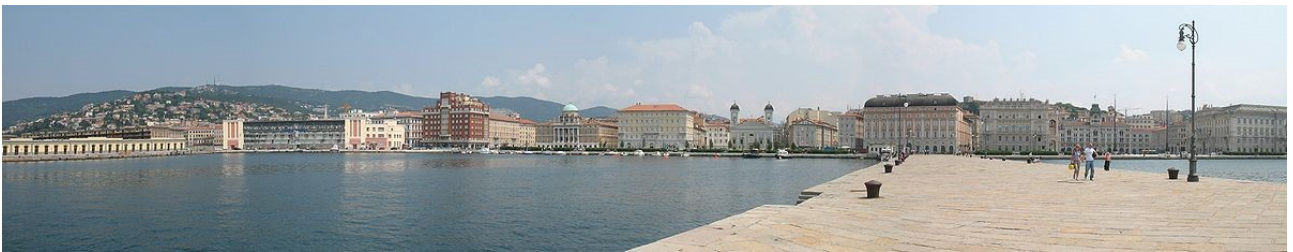
Le cosiddette “rive” viste dal Molo Audace. Visibile la Chiesa greco-ortodossa