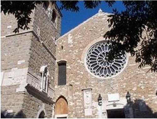
Cattedrale di san Giusto