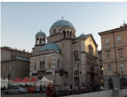
Tempio serbo-ortodosso di san Spiridione