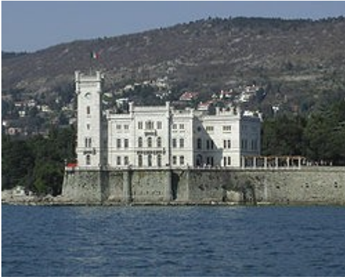
Il celebre castello di Miramare