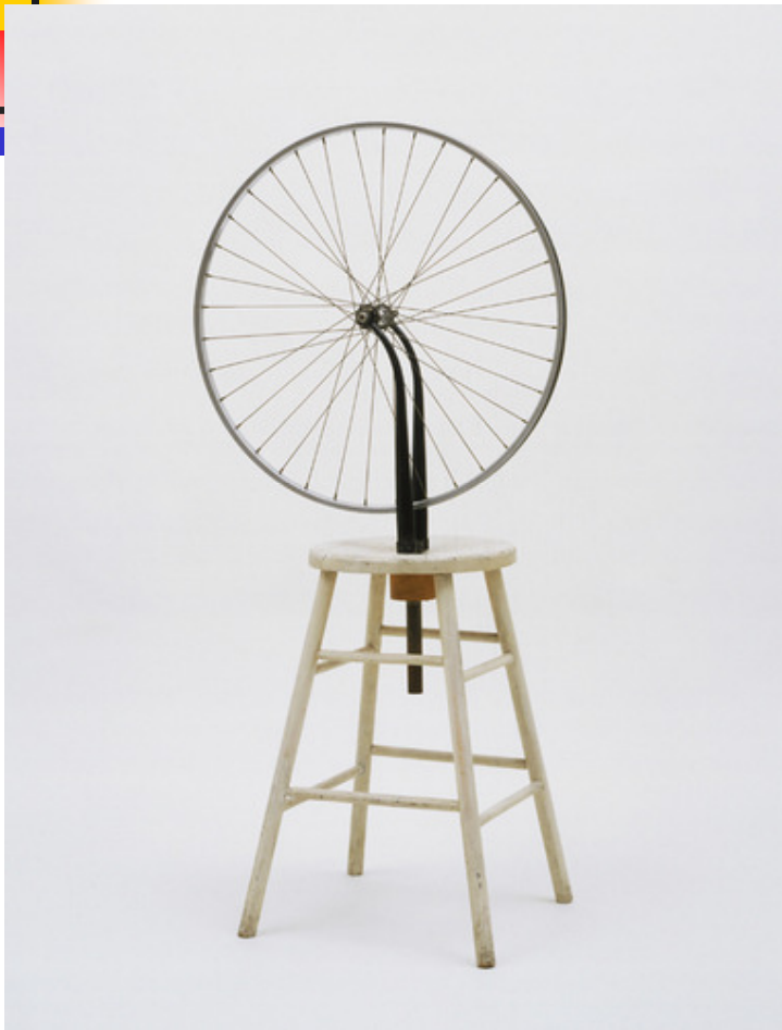
Marcel Duchamp, Kolo z bicyklu , 1913