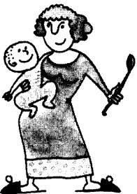
Ji yra namų šeimininkė.