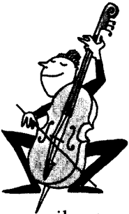
Jis yra muzikantas.