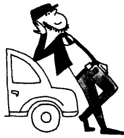
Jis yra vairuotojas.