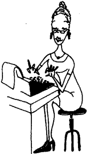
Ji yra sekretorė.