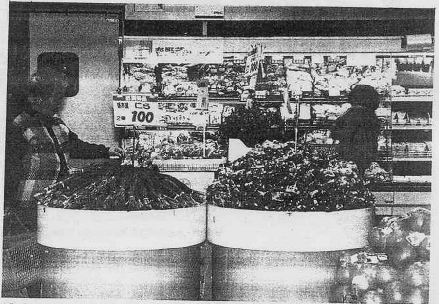
Sūpā de no kaimono: Shopping at a supermarket

研修生のリーさんは田中さんのうちに招待されました。田中さん一家のもてなしで、リーさんはすっかりくつろぎ、話もはずみました。リーさんは日本人の生活に関心があるので (1) 、次々に田中さんに質問します。