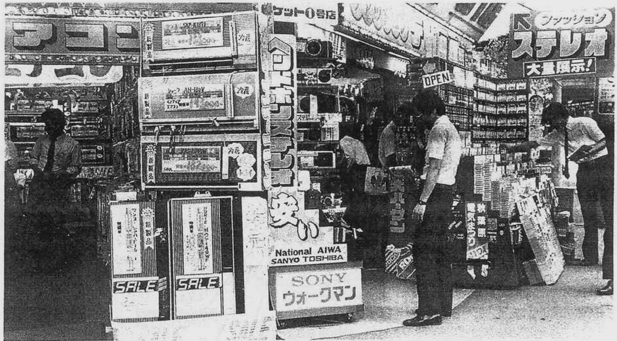
Akihabara no denki shōtengai: Electrical appliance shops at Akihabara, Tokyo

リー：でも、食べる物が高すぎる (2) と思いませんか。1回の食事代が500円から1,000円。コーヒー1ぱい350円。小づかいがすぐなくなってしまいます。