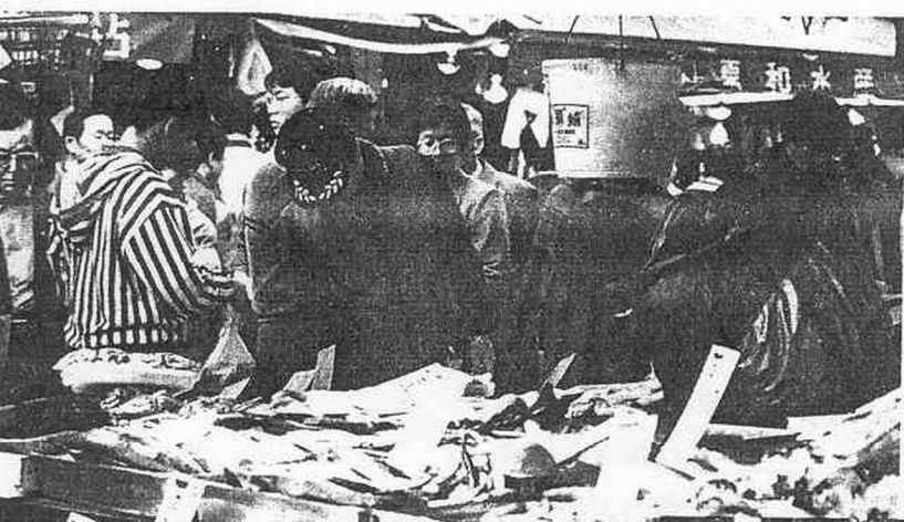
Daihanjō no Ueno no sakanaya: Prosperous fish shops at Ueno, Tokyo

田中さんの 家計は 平均的 サラリーマンの 家庭の 特徴を 良く 示して いると 言えるでしょう。