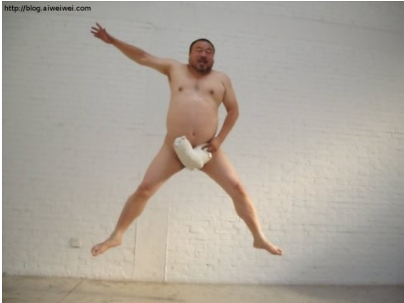
Ai Weiwei, 2009, Lama zakrývající rozkrok