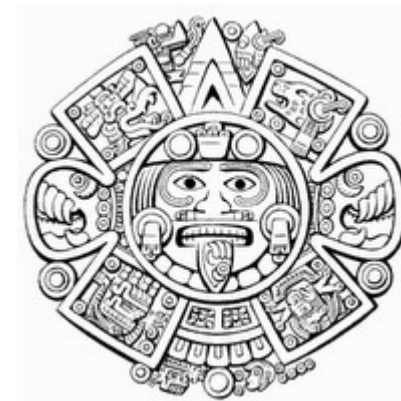
Předkolumbovské civilizace na území dnešního Mexika