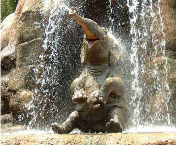
elefánt - elefántok - elefántot - elefántom