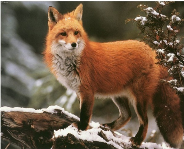
róka - rókák - rókát – rókám