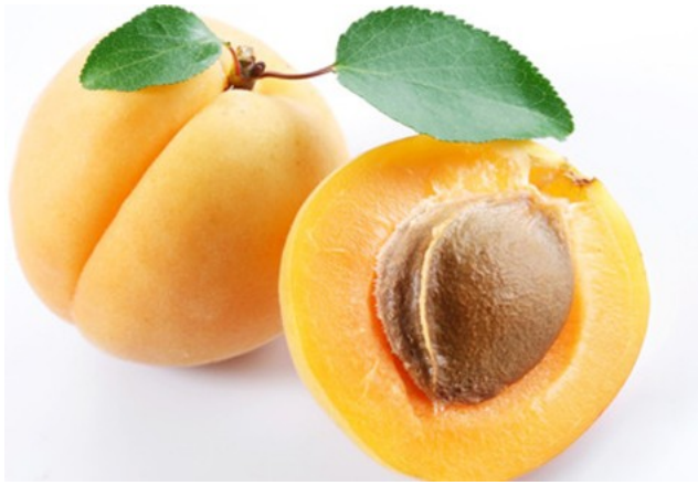
sárgabarack = kajszibarack