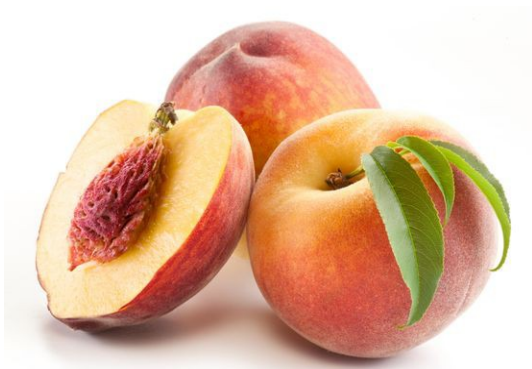
őszibarack (ősz: podzim)