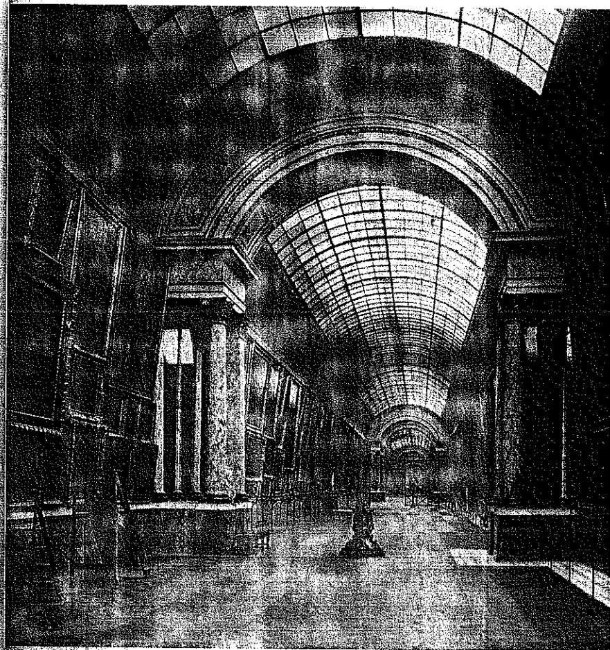
1. Grande Galerie v Musée du Louvre, Paříž, fotografie z 19. století