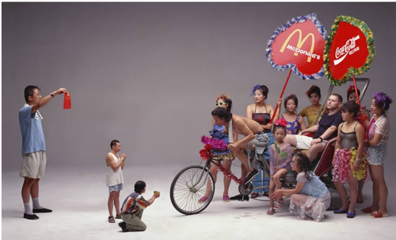
„Can I Cooperate with You?“, Wang Qingsong, 2000