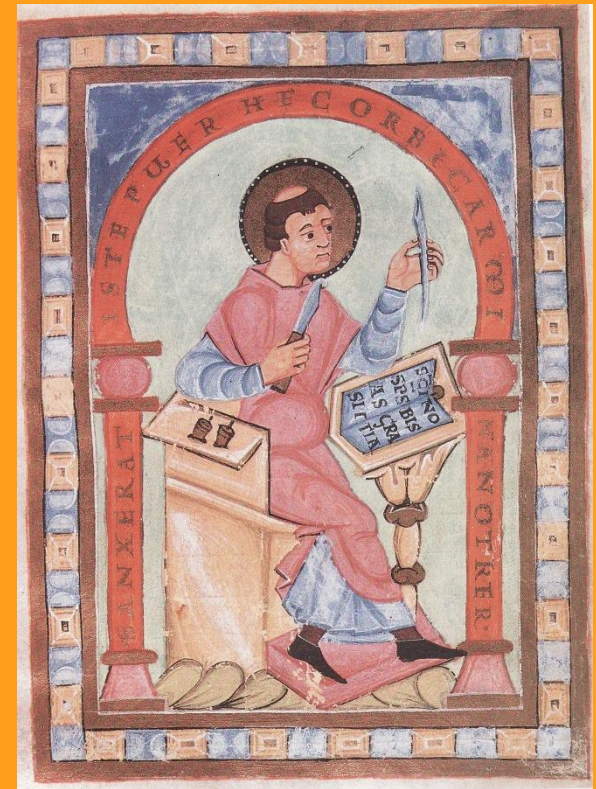
Notker Balbulus jako písař