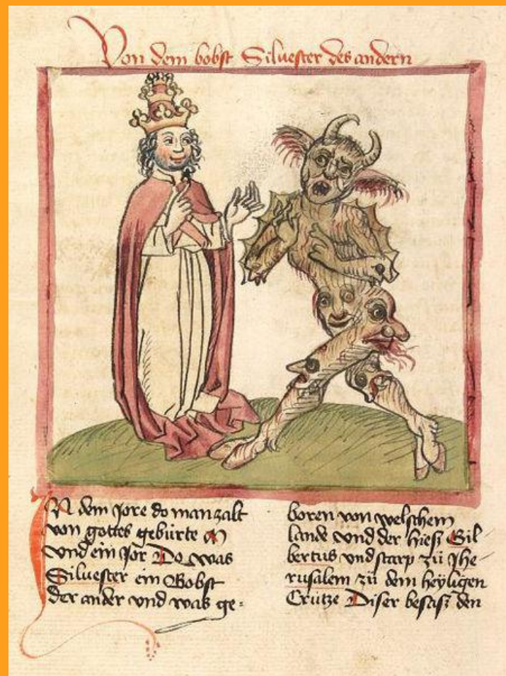
papež Silvest II. s ďáblem (ca. 1460)

Heidelberg, Cod. Pal. Germ. 137, f. 216v