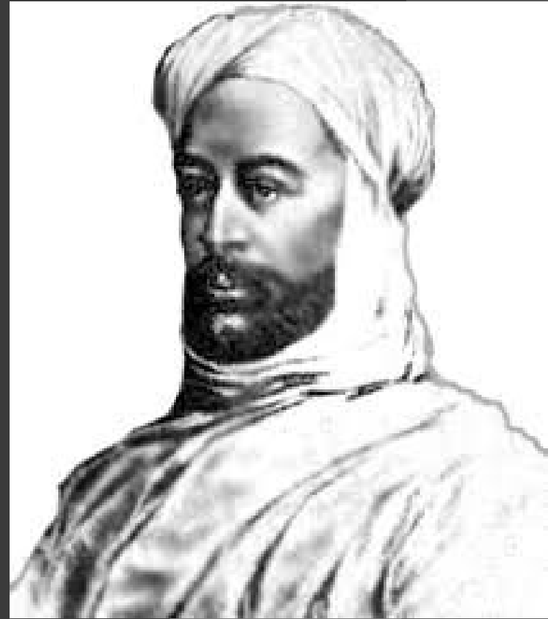
Muhammad Ahmad al-Mahdí