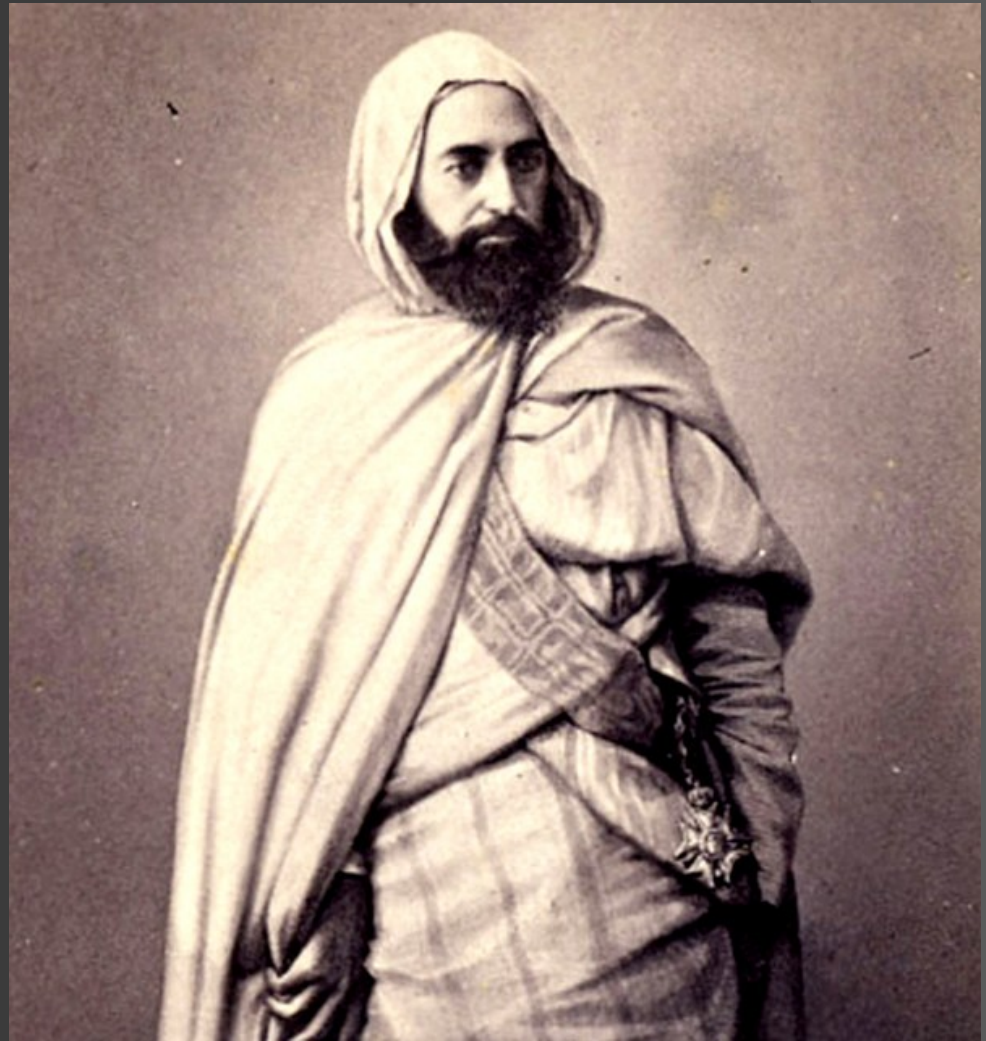
Abd al-Qadir al-Jazairi