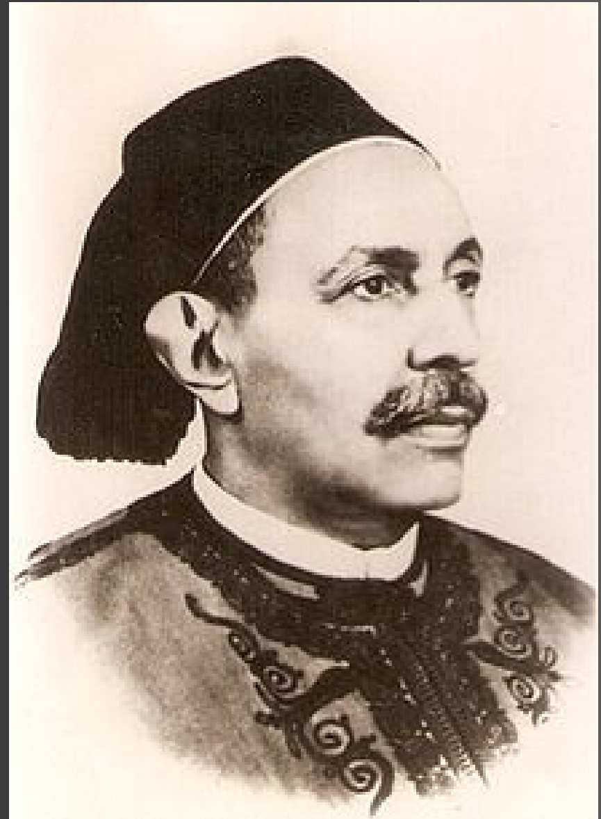
Sidi Muhammad Idris al-Mahdi al-Senussi, King of Libya