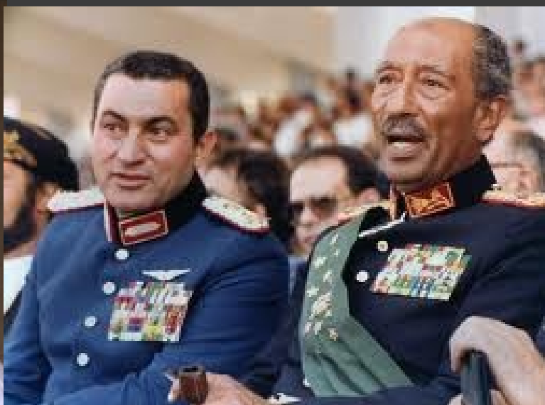
Mubarak a Sádát