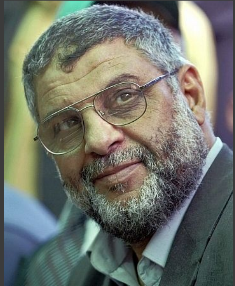
Abd al-Azíz ar-Rantíssí