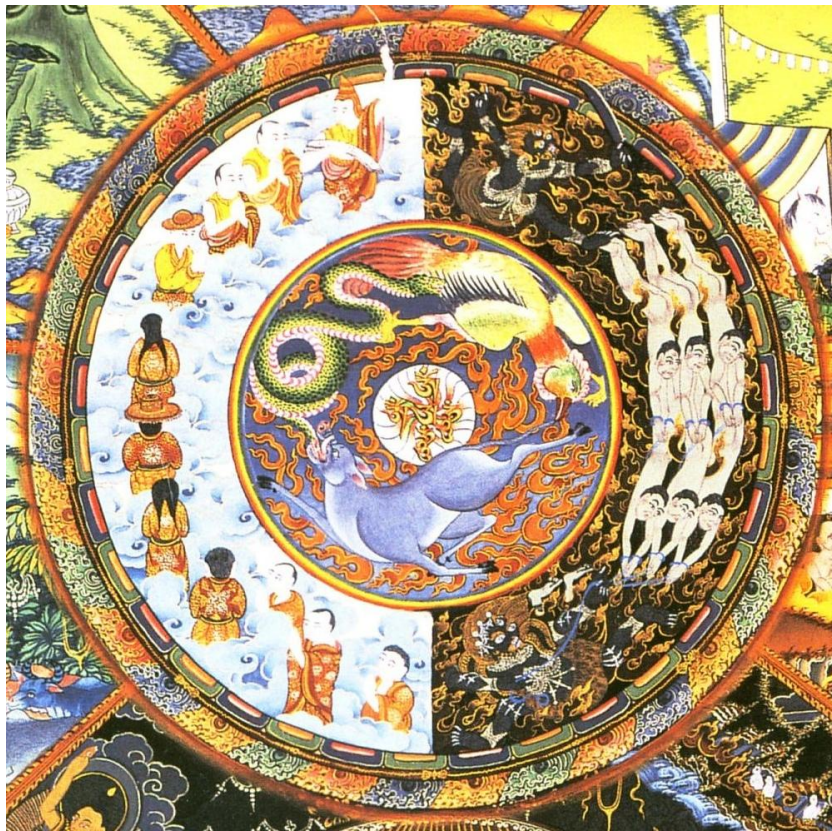
Bhavačakra – tři kořeny zla

Dohromady to jsou tři kořeny zla, tři jedy, které musí adept buddhistického probuzení a nirvány v sobě vykořenit. Jsou to původci dalšího sansárského zapletení každého individua, každé bytosti ve všech říších.