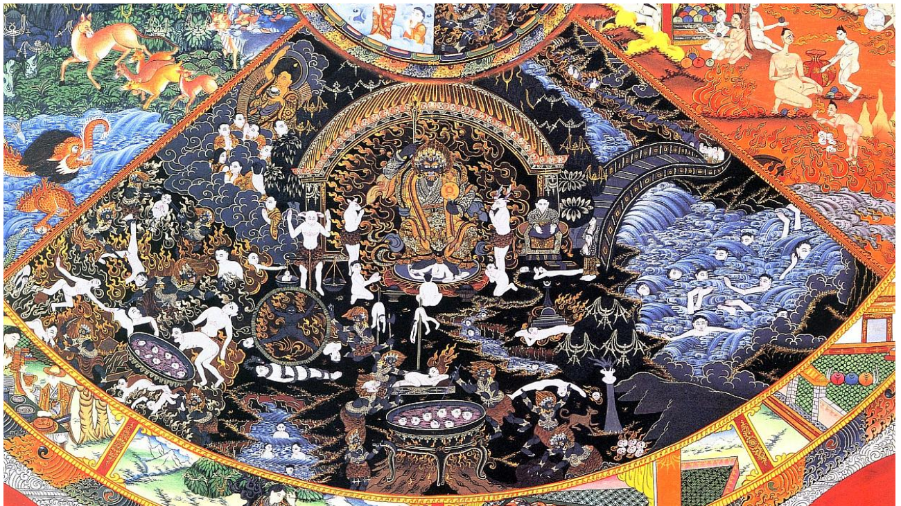
Bhavačakra – říše pekelných bytostí

6. Říše pekelných bytostí (sa. naraka , tib. ñalwā /dmjal ba/ , mong. tamyn am'tad ). K pekle toho není třeba příliš dodávat, snad jen to, že se dělí na dvě podpekla, horké a studené.