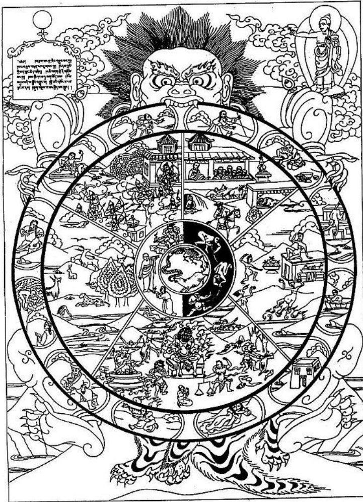
Bhavačakra - tibetský xylograf