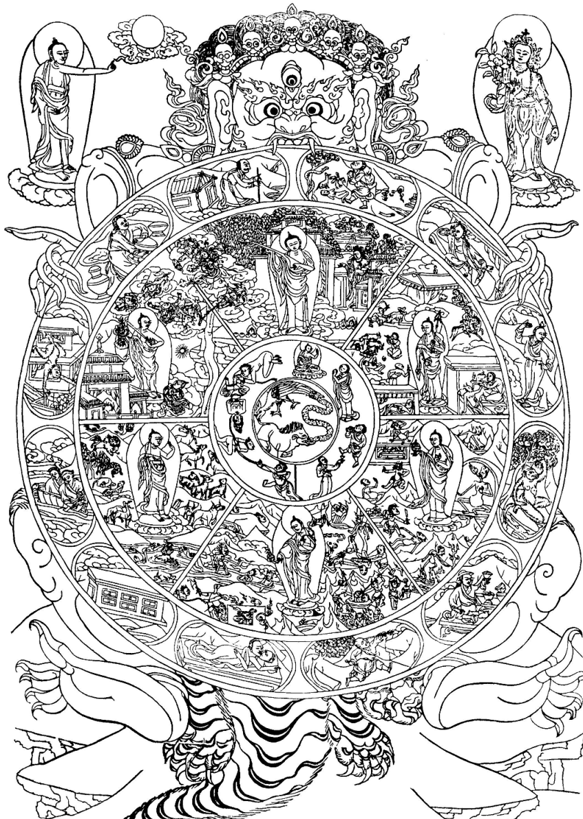
Bhavačakra – tibetská xylografie

Pro pochopení této představy je vhodné vyjít například z tibetského zobrazení kola života, bytí, (sa. bhavačakra , tib. sidpā khorlo /srid pa 'khor lo/ ) zobrazujícího šest říší či stavů existence. Přechod mezi jednotlivými říšemi či stavy je podmíněn smrtí daného individua. Smrt je tedy chápána jako změna stavu, která se často opakuje a sama o sobě není o nic útrpnější než například zrození. Smrt tedy není nic definitivního, konečného, smrt se stále – dokud je bytost v zajetí sansáry – opakuje, navrácí, vždy ovšem vyjadřuje změnu stavu. Ostatně o tom vypráví i první vznešená pravda, kterou Buddha Šákjamuni proslovil, kde je zrození, stejně jako smrt naplněno utrpením: „Zrození je utrpení, stárnutí je utrpení, nemoc je utrpení, smrt je utrpení, být spojen s tím, co je nemilé, je utrpení, být oddělen od toho, co je milé, je utrpení, nedostat to, co si přejeme, je utrpení.“ 3 A přesto existuje v buddhismu pojetí stavu bez smrti – totiž stavu kdy není ani zrození, kdy ustane veškerá karma daného individua, zkrátka nirvána .