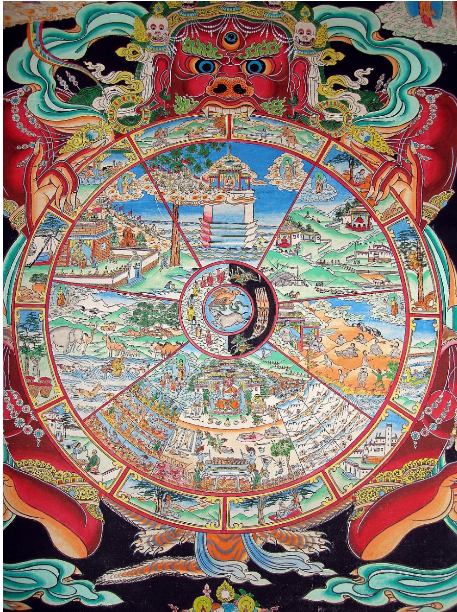
Bhavačakra – tibetská kolorovaná xylografie

Prolomení řetězce sansáry, znovuzrození neznamená, že jedinec dosáhne stavu nesmrtnosti v našem běžném pojetí (nesmrtnost = věčný život). Je to jinak, je to spíše stav bezsmrti . Smrt je změna stavu, nutná přechodová fáze mezi jednotlivými stavy zrození (sa. gati ). Kdo se více již nezrodí, kdo dosáhl ustání karmy, kdo se stal buddhou, nemůže již zemřít. Protože smrt je změna stavu. A buddha již svůj stav nemění. Vymanil se ze sansáry, již více není podrobován zrozením. Obyčejné, tělesné smrti se ovšem v žádném případě vyhnout nelze. Jde o to jak ji vyložit. Například jako odhození tělesné schránky, která se třeba již stala přítěží. Smrt těla je nutná a zákonitá vždy, lze ji odkládat, nelze se jí vyhnout. Tuto skutečnost je možné ilustrovat na příběhu samotného Buddha Šákjamuniho. Rozdíl mezi nirvánou a maháparinirvánou představuje v jeho životě zhruba čtyři dekády, naplněné učitelskou činností. Z hlediska Buddha byl rozhodující první moment, probuzení, dosažení stavu nirvány ve zhruba šestatřiceti letech. Dosažení konečné nirvány nepředstavovalo pro něj samotnou žádnou podstatnou změnu. Bylo to pouze to, co ostatní lidé nazývají smrtí. Pro Buddha to smrt vlastně nebyla, neboť smrt, jak již bylo výše řečeno, je změnou stavu, předpokladem pro další roztáčení kola sansáry. Buddha již žádné změně podroben není,