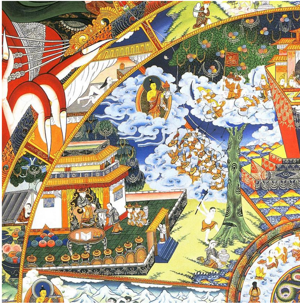
Bhavačakra - říše polobohů

2. Říše polobohů, či polobožstev, duchů (sa. asura , tib. lhamajin / lha ma jin /, mong. asuri nebo tenger biš ), zahrnující potměšilé bytosti, velmi podobné bohům, či božstvům, jsou však s nimi v neustálém konfliktu. Tibetský termín doslova znamená „ne-bohové“. Jsou známí i jako „titáni“ a někdy bývají jako gati přiřazováni k dobrým, jindy ke špatným zrozením (sa. apája ). Asurové chápaní jako dobrý stav představují božstva, která žijí na úbočích či vrcholcích Méru, či sídlí ve vzdušných, nebeských palácích. Asurové chápaní jako špatný stav představují nepřátele bohů, či božstev (sa. déva ). Asurové patří do oblasti smyslové žádosti (viz sa. trilóka ). V klasifikaci jižního buddhismu asurové chybí, nejsou tam známí. (LVM 24-25)