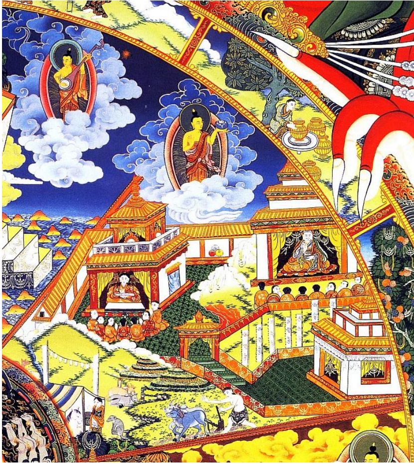
Bhavaçakra - říše lidí