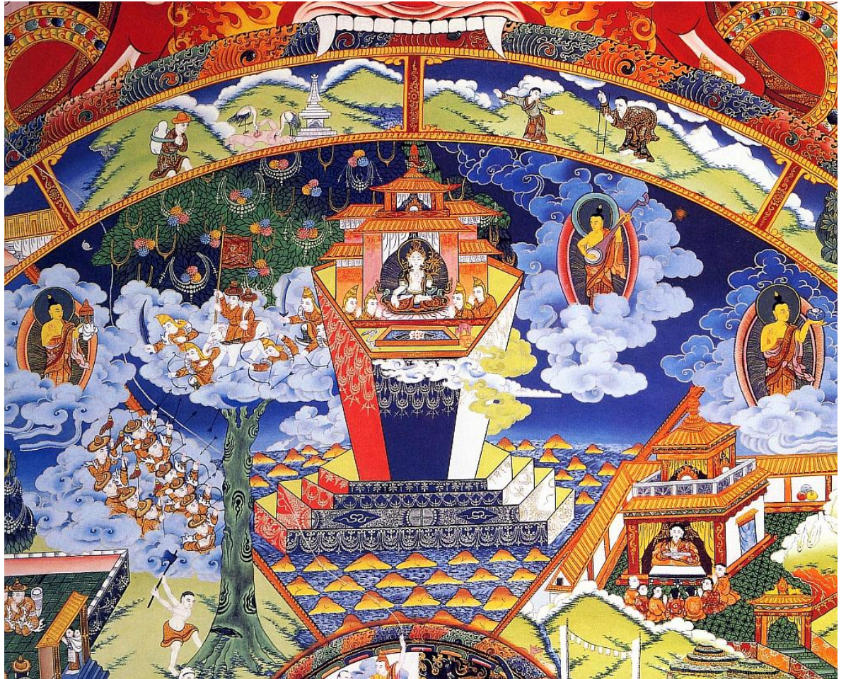
Bhavačakra - říše bohů

1. Vrchní představuje říši bohů, či božstev (sa. déva , tib. lha /lha/ , mong. tenger nar ), zahrnující bytosti ve třech oblastech: a) světě nebeských forem (sa. rúpadhátu , tib. /gzugs khams/ ), b) světě bez forem (sa. arúpadhátu , tib. /gzugs med khams/ ), čili duchů bez formy a c) světě smyslové touhy (sa. kámadhátu , tib. /'dod khams/ ), kde se vyskytuje šest kategorií bohů nacházejících se ve smyslovém světě.