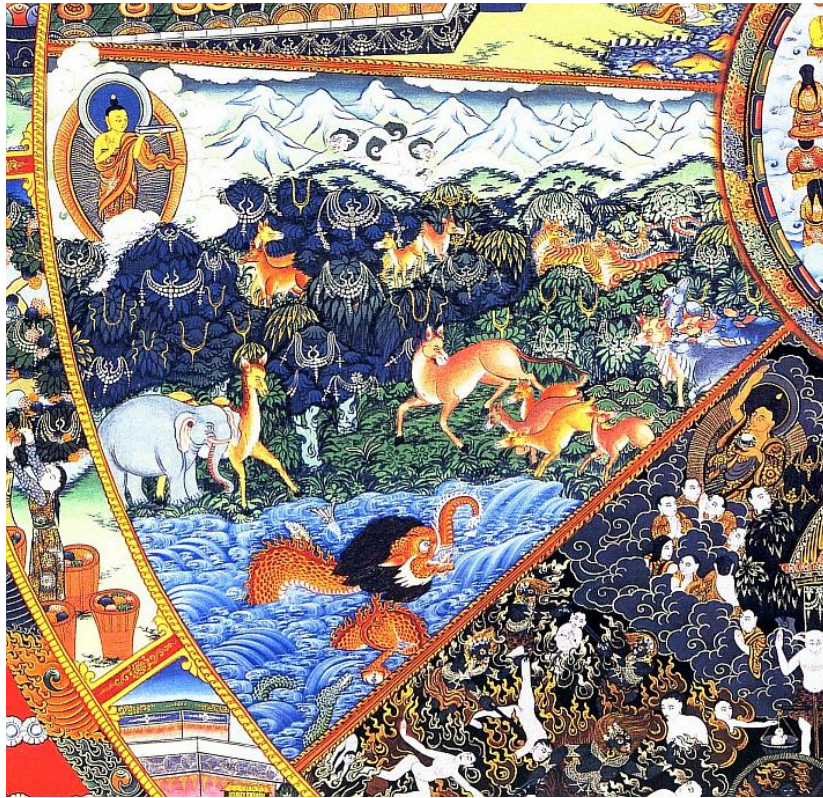
Bhavačakra – říše zvířat