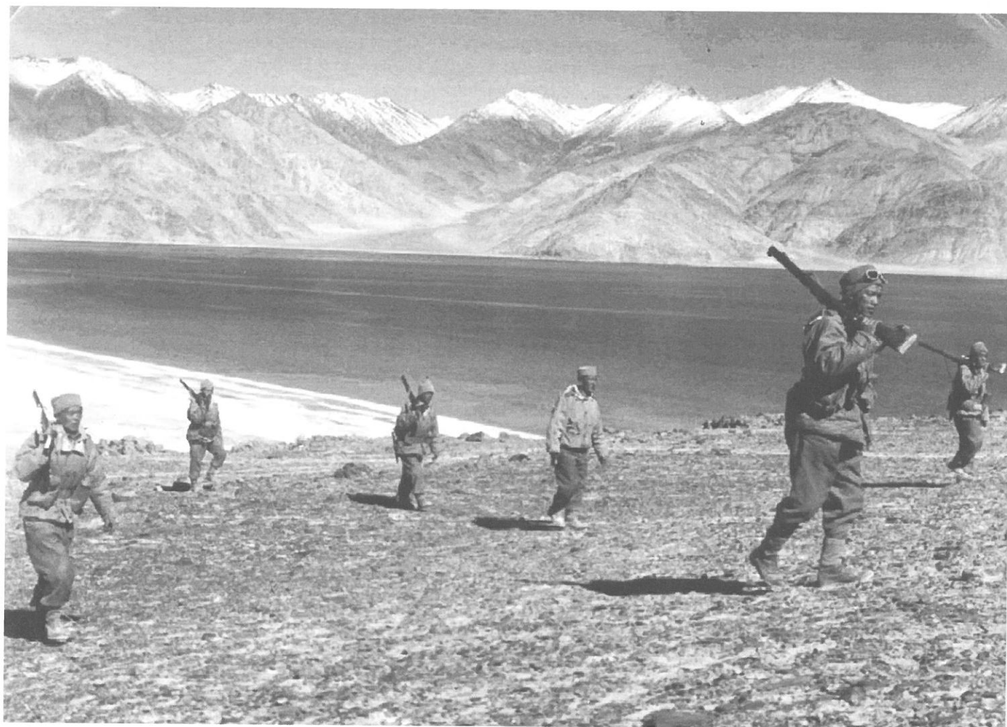
Indická patrola v Aksai Čínu.

sektoru představovala kromě celkově nevyřešeného statutu tzv. McMahonovy linie specifický problém otázka enklávy a kláštera Tawangu (tzv. Tawang tract). Britská správa mezi lety 1940–1945 předložila vládě ve Lhasě ve věci vymezení hranice v tomto úseku několik návrhů, jež ponechávaly samotný klášter na tibetské straně. Tibetská vláda však na britské nabídky nereagovala a v roce 1945 a znovu v roce 1947 vznesla vlastní územní požadavky, v druhém případě již adresované vládě nezávislé Indie. 2 V okamžiku vyhlášení indické nezávislosti nebyla otázka hranice v oblasti Tawangu vůbec nijak řešena – nevztahovalo se na ni ani celkové indicko-tibetské ujednání ohledně McMahonovy linie. Obdobná situace panovala v západním sektoru v oblasti Ladákh: poslední mapa, kterou Britové vypracovali pro potřeby Kabinetní mise vyslané do Indie v roce 1946, ponechávala celou tuto oblast bez jakéhokoli vymezení hraniční čarou – veškeré předchozí úvahy britských koloniálních strategií ohledně