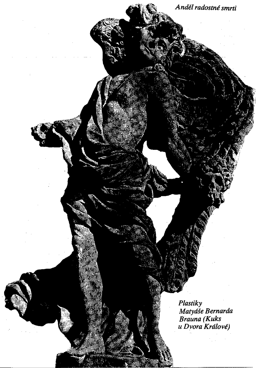
Plastiky Matyáše Bernarda Brauna (Kuks u Dyora Králové)