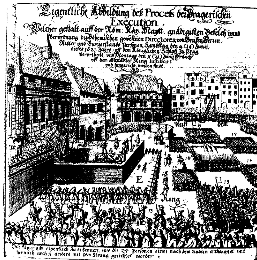
Poprava českých pánů na Staroměstském náměstí 21. června 1621 (dobový leták)

Válka se z Čech a Moravy přenesla na území Říše, kde zakrátko ztratil Friedrich Falcký své veškeré pozice v Horní a Dolní Falci. Sám Friedrich byl na říšském sněmu, silně ovlivňovaném Ferdinandem II., zbaven své kurfiřtské hodnosti, kterou získal na základě předchozích tajných dohod věrný katolík Maxmilián Bavorský.