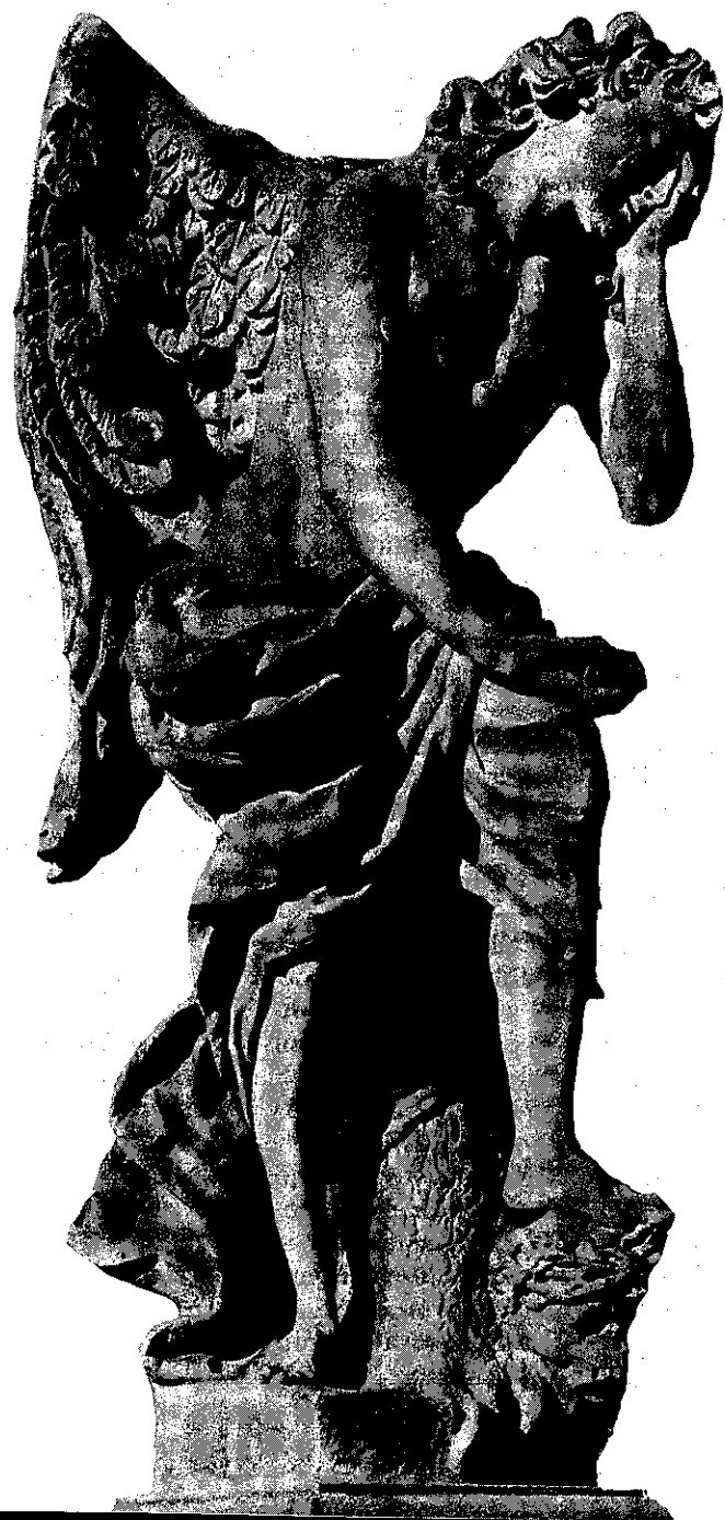
Anděl žalostné smrti