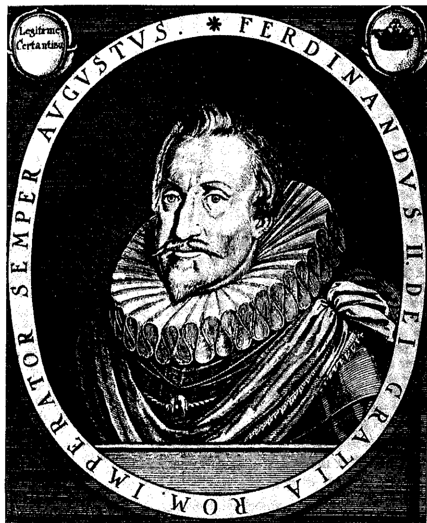
Císař Ferdinand II. (soudobá rytina)