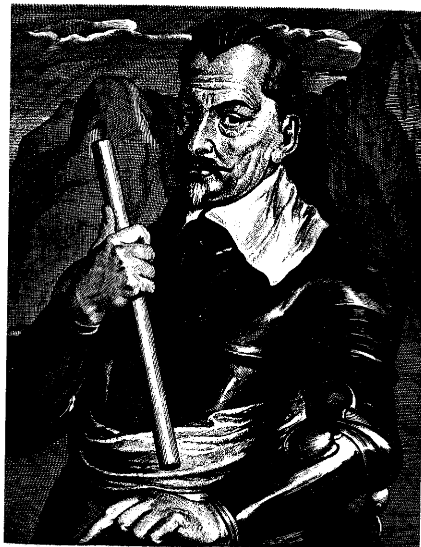
ALBERT. DVX. FRITLAND. COM. WALLF. ST. ETC

V dubnu 1626 porazil Valdštejn protestantské oddíly (velel jim generál Mansfeld) u Dessavy, zatímco dánský král Kristián IV. usiloval o ovládnutí říšských přímořských území mezi ústím Labe a Vesery. Spojené protestantské armády chtěly uskutečnit tažení na Vídeň, ale jejich plány ztroskotaly jednak na porážce u Dessavy, jednak na liknavém a vypočítavém postupu sedmihradského Gáboru Bethléna. Velký vojenský neúspěch utrpěl i dánský král v srpnu roku 1626 u Lutteru.