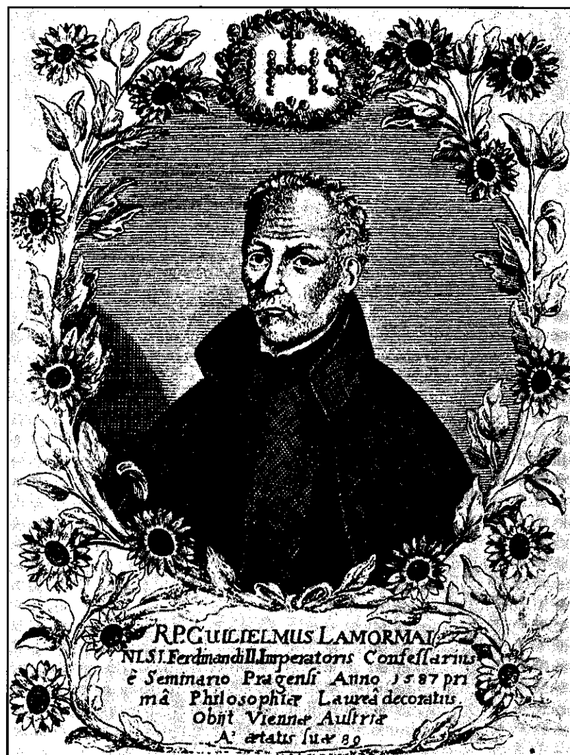
Zpovědník Ferdinanda II. páter Lamormain