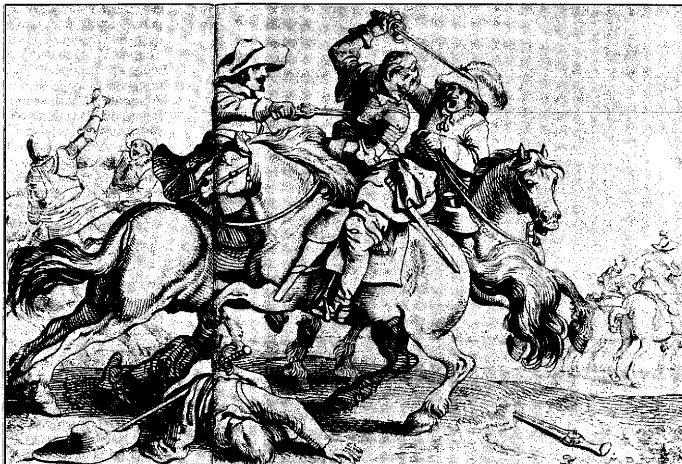
Bíтва třicetileté války (soudobá rytina)

nenalezl odezvu mezi obyvatelstvem, ale naopak vyvolal prudký odpor. Poté, co Švédové dobyli Malou Stranu a Hradčany, se vytvořily dobrovolnické legie k obraně pražských měst, mezi nimiž vynikli hlavně studenti a profesori pražských vysokých škol. Prahu se podařilo uhájit a na paměť tohoto vítězství byl na Staroměstském náměstí vystavěn Mariánský sloup, stržený roku 1918 (neprávem jako symbol habsburské nadvlády). Švédové po obsazení Hradu uloupili část vzácných uměleckých sbírek, které jsou dosud v majetku Švédského království.