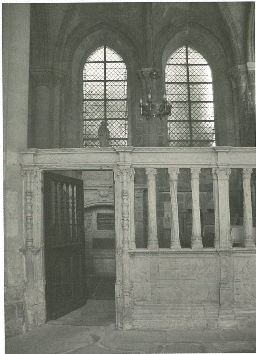
Kaple s hrobkou opata Viléma z Volpiana. Klášter Sainte-Trinité ve Fécampu.

a velmi moudrý muž, 50 a také již zmíněný vynikající opat a zakladatel klášterů Vilém, o němž by bylo možno říci přemnoho prospěšného, kdyby to nebylo už dříve zaznamenáno v knížce, kterou jsme, jak známo, o jeho životě a zázracích sepsali. 51 Přece však vím, že zbývá ještě jedna příhoda, která v ní není zmíněna. Otec Vilém se odebral z tohoto světa do blaženství svatých na území Neustrie, 52 v klášteře Fécampu, který leží u oceánu asi čtyřicet mil od Rouenu; 53 byl pochován, jak se sluší u tak velkého muže, na nejlepším místě v kostele. Po několika dnech se stalo, že asi desetiletý chlapec těžce onemocněl. Rodiče ho přivedli k opatovu hrobu v naději, že mu bude navraceno zdraví, a nechali ho tam samotného ležet. On se náhle ohlédl a spatřil na náhrobku sedět ptáčka, který vypadal jako holubice: dlouho se na ni díval, až usnul. Když se probudil z klidného spánku, shledal, že je zdravý, jako by nikdy nestonal. Rodiče si radostně vzali svého chlapce zpět a nastalo všeobecné veselí.