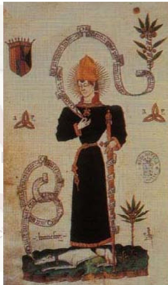
Carles de Viana

1460 se vrátil do Katalánska a Navarry, kde měl být v pozici místokrále (Katalánsko) a krále (Navarra) → opět zavřen. Propuštěn až na základě rozhodnutí katalánských Corts → slavnostně přijat v Barceloně jako místokrál (katalánské elity neměly Joana II rády).