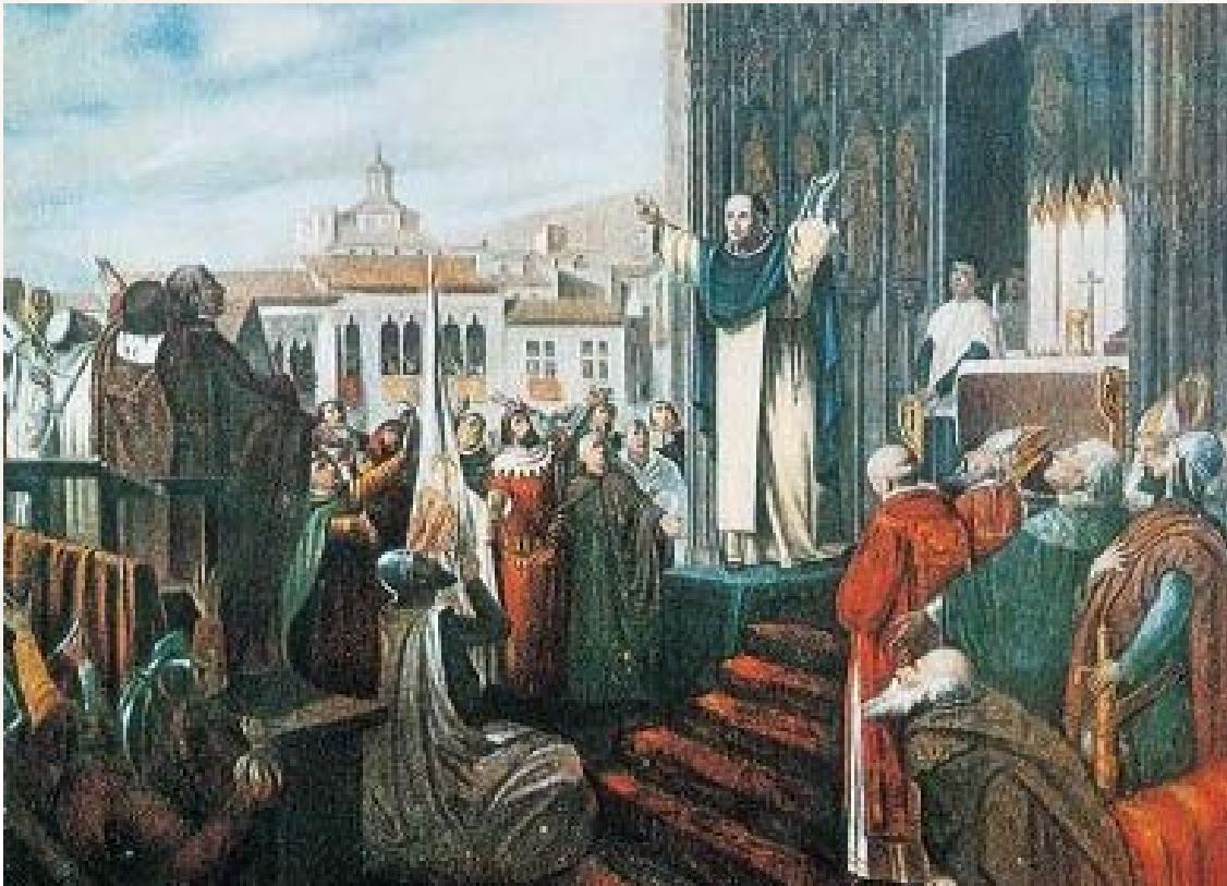
Vyhlášení výsledků volby z Casp