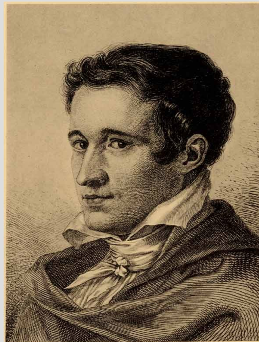
93. Jacob Grimm