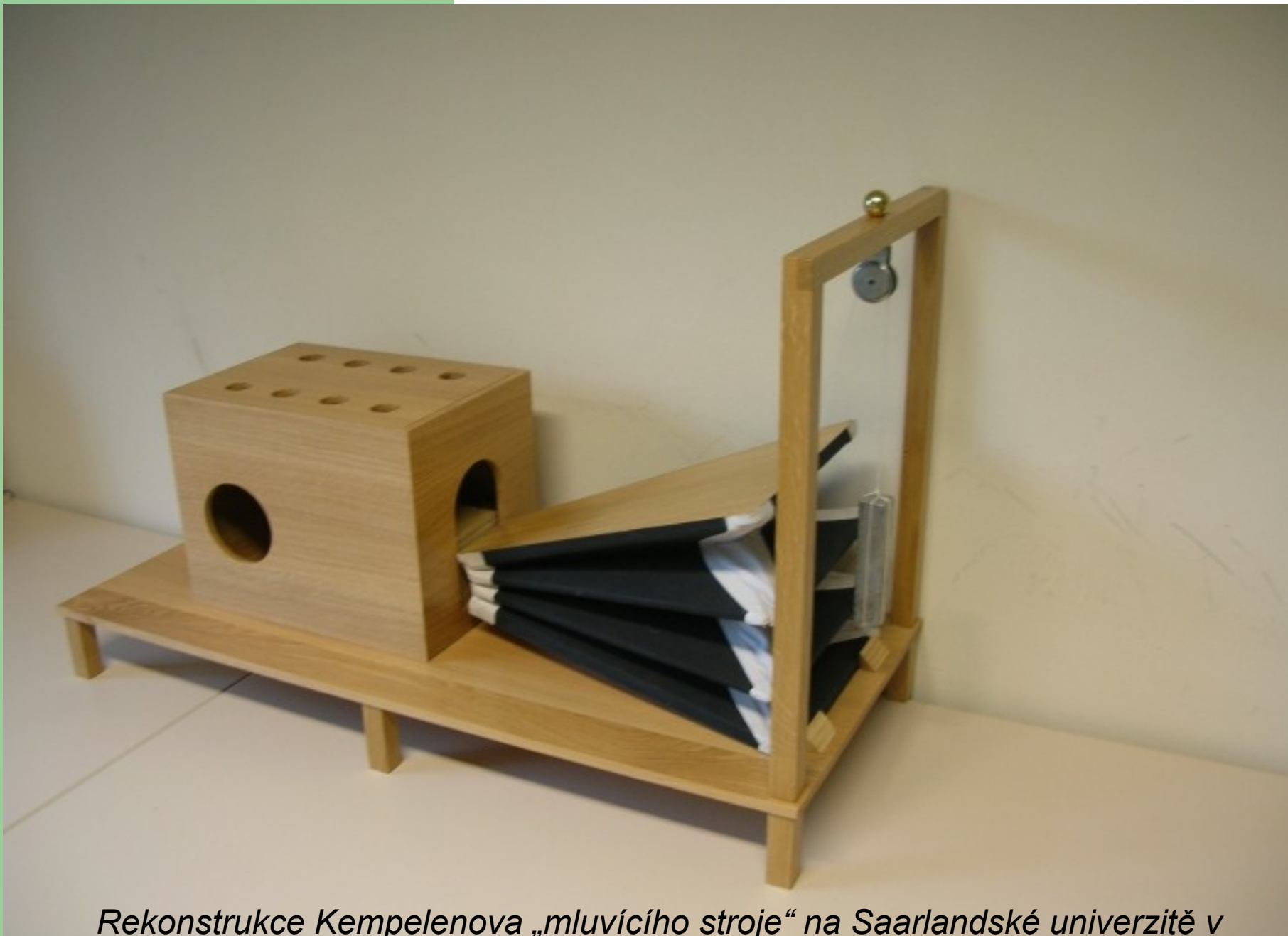
Rekonstrukce Kempelenova „mluvícího stroje“ na Saarlandské univerzitě v Saarbrückenu