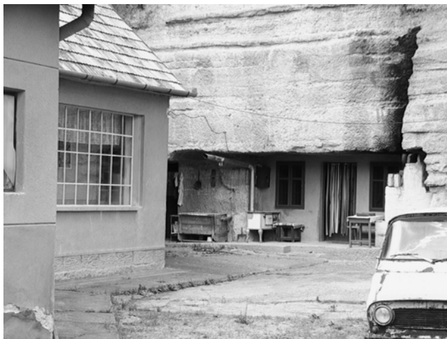
Skalné obydlie v Brhlovciach. (2003)

Pamiatkovo chránené súbory ľudovej architektúry z 19. a 20. storočia sa nachádzajú v Banskom Studenci, Cerove, Sucháni či Dačovom Lome. Vinohradnícka osada v chotári obce Sebechleby, nazývaná Stará Hora, je rezerváciou ľudovej architektúry.