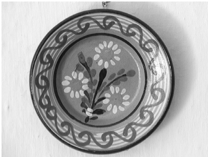
Pukanská keramika. (2005)

baníka a modely baní, ktoré sa vkladali aj do fliaš. Pri výrobe modelov využívali aj miestne minerály. Ženy baníkov sa venovali výrobe čipiek na predaj, tzv. banickej čipke. Charakteristické pre región boli hodrušské čipky. Kým v poľnohospodárskej časti Hontu slúžila ľudová výroba prevažne len pre domácu spotrebu, v mestách Banská Štiavnica, Pukanec, Krupina, Bátovce a Sebechleby sa rozvinula do remeselnej výroby.