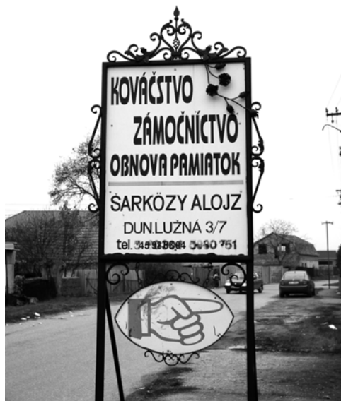
Kováčska dielňa v Dunajskej Lužnej. (2004)

rých iných zložkách tradičnej kultúry. V 17. storočí sa v Komárne usídlili srbskí utečenci pred Turkami, ktorí tu založili pravoslávnu cirkevnú obec. Hlásili sa k nej tiež bulharskí zeleninári, ktorí boli v Komárne a jeho okolí výraznejšie koncentrovaní.