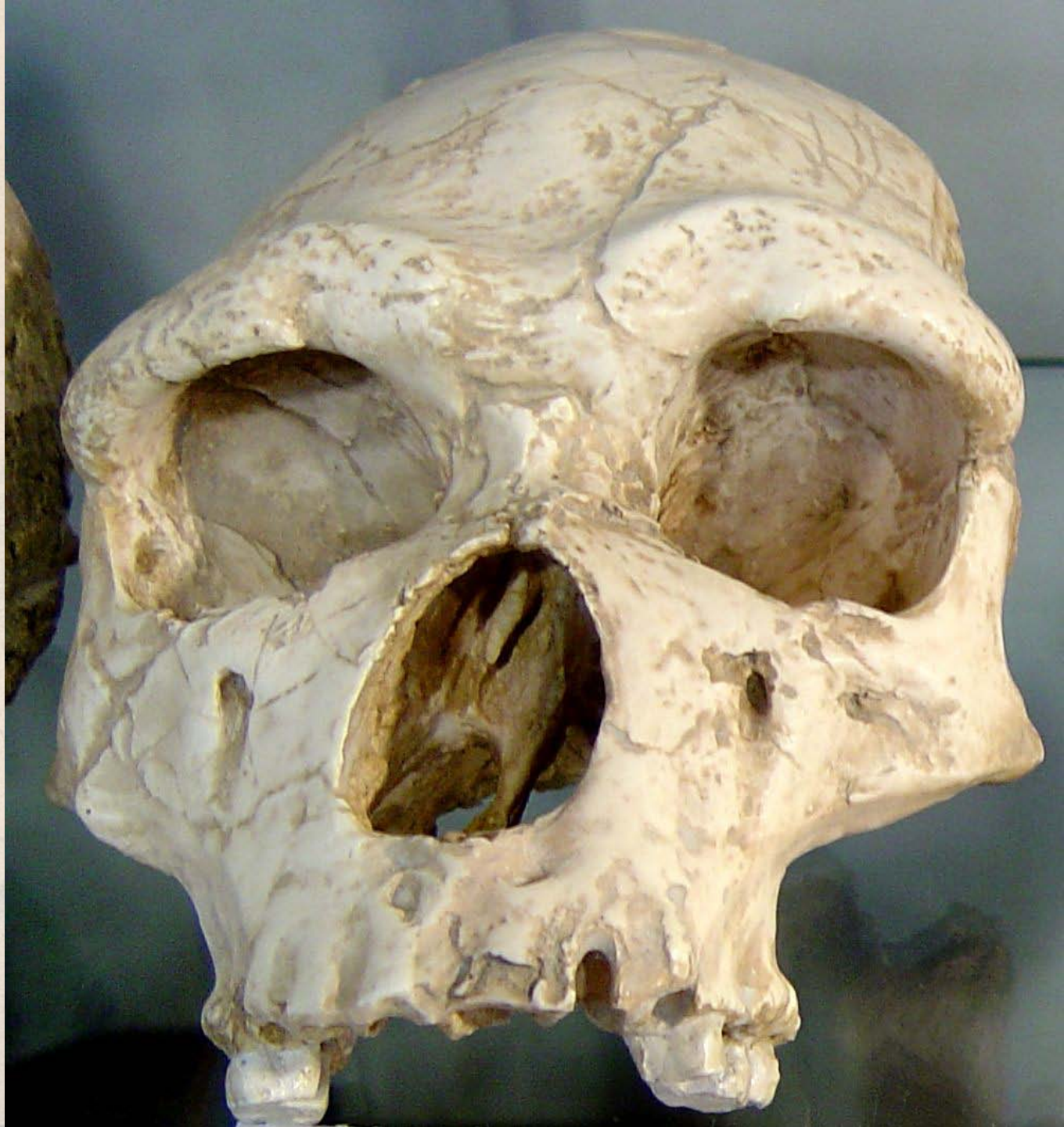
Lebka člověka z Taltaüll