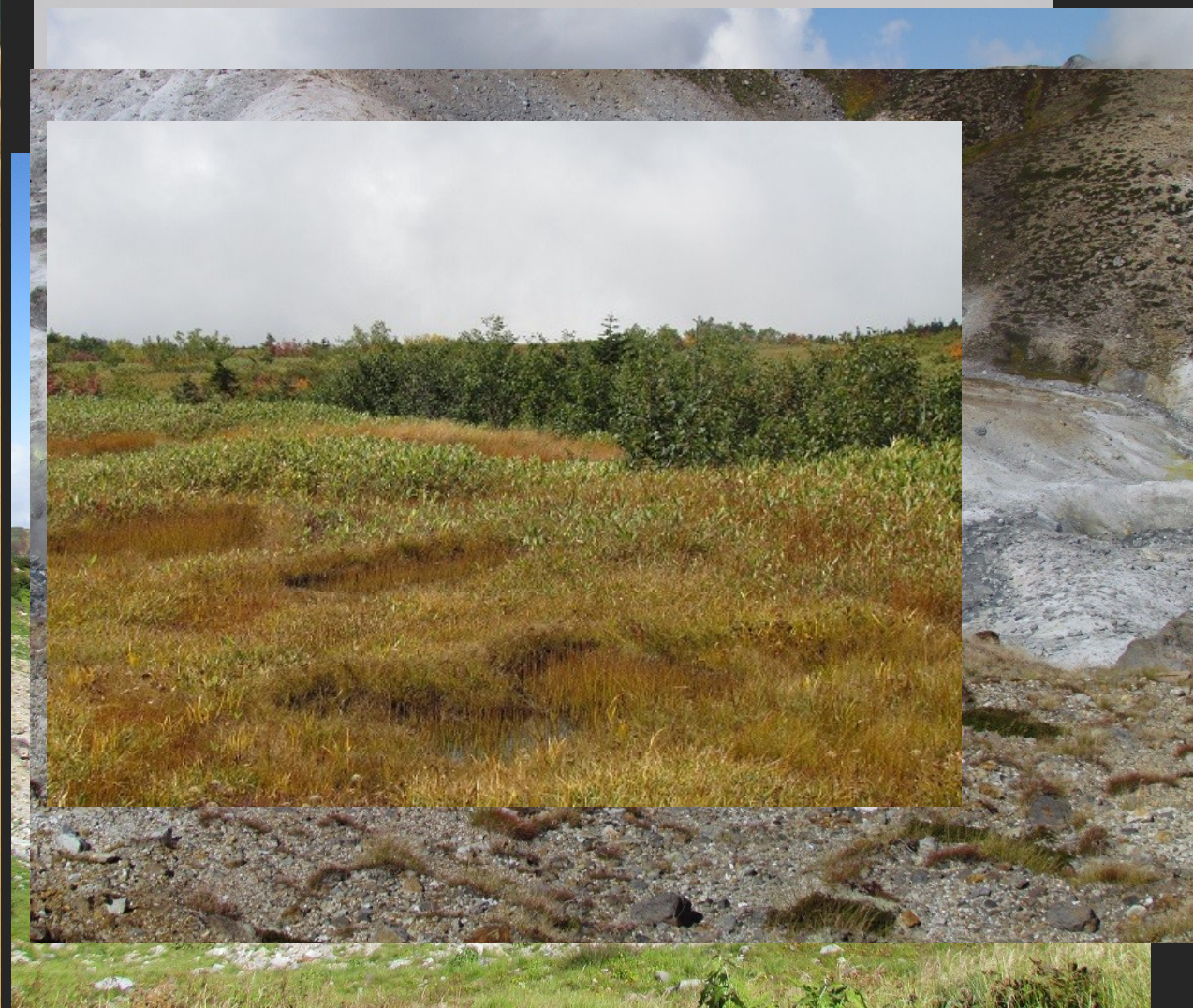
Tatajama mandala z Daisenbó