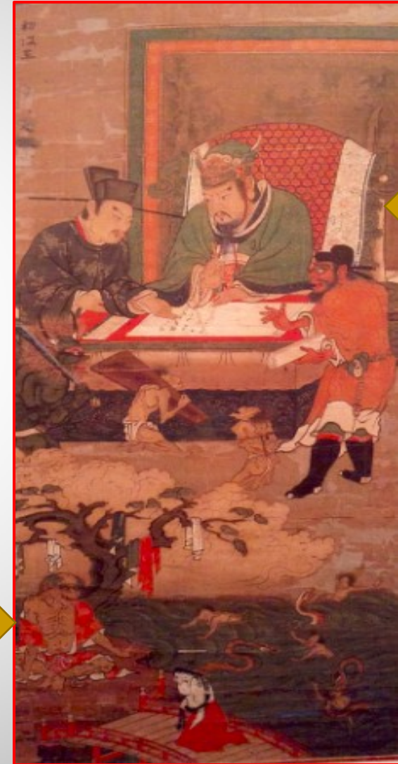
Druhý kráľ Šokó