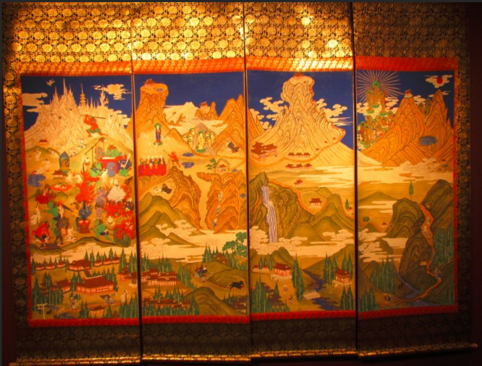
Iwakuradži, Čúdóbó, druhá polovica 19. storčia