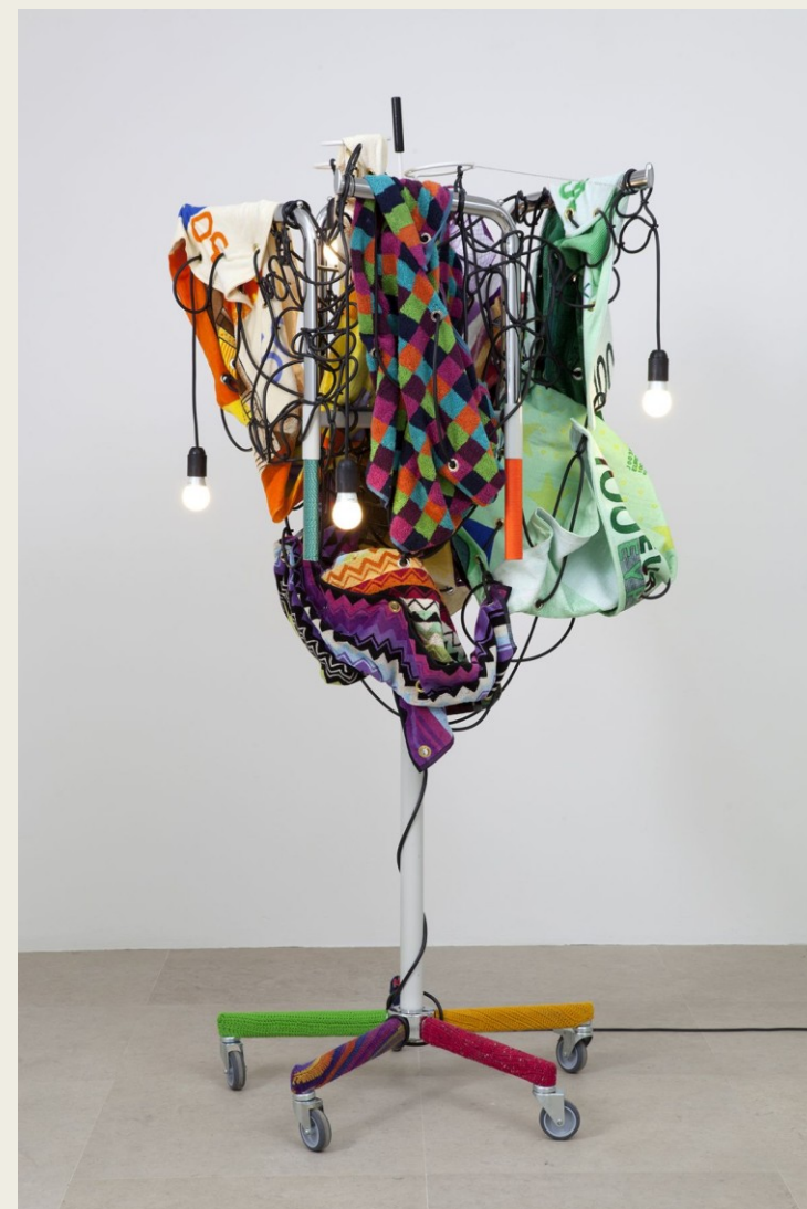
Haegue Yang - Towel Light Sculpture