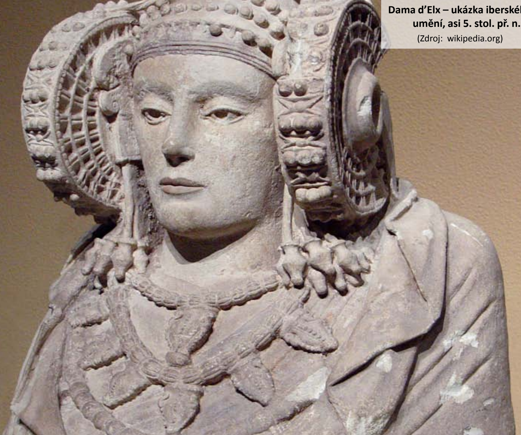
Dama d'Elx – ukázka iberského umění, asi 5. stol. př. n. l.