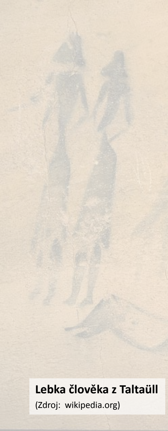
Lebka člověka z Taltaüll