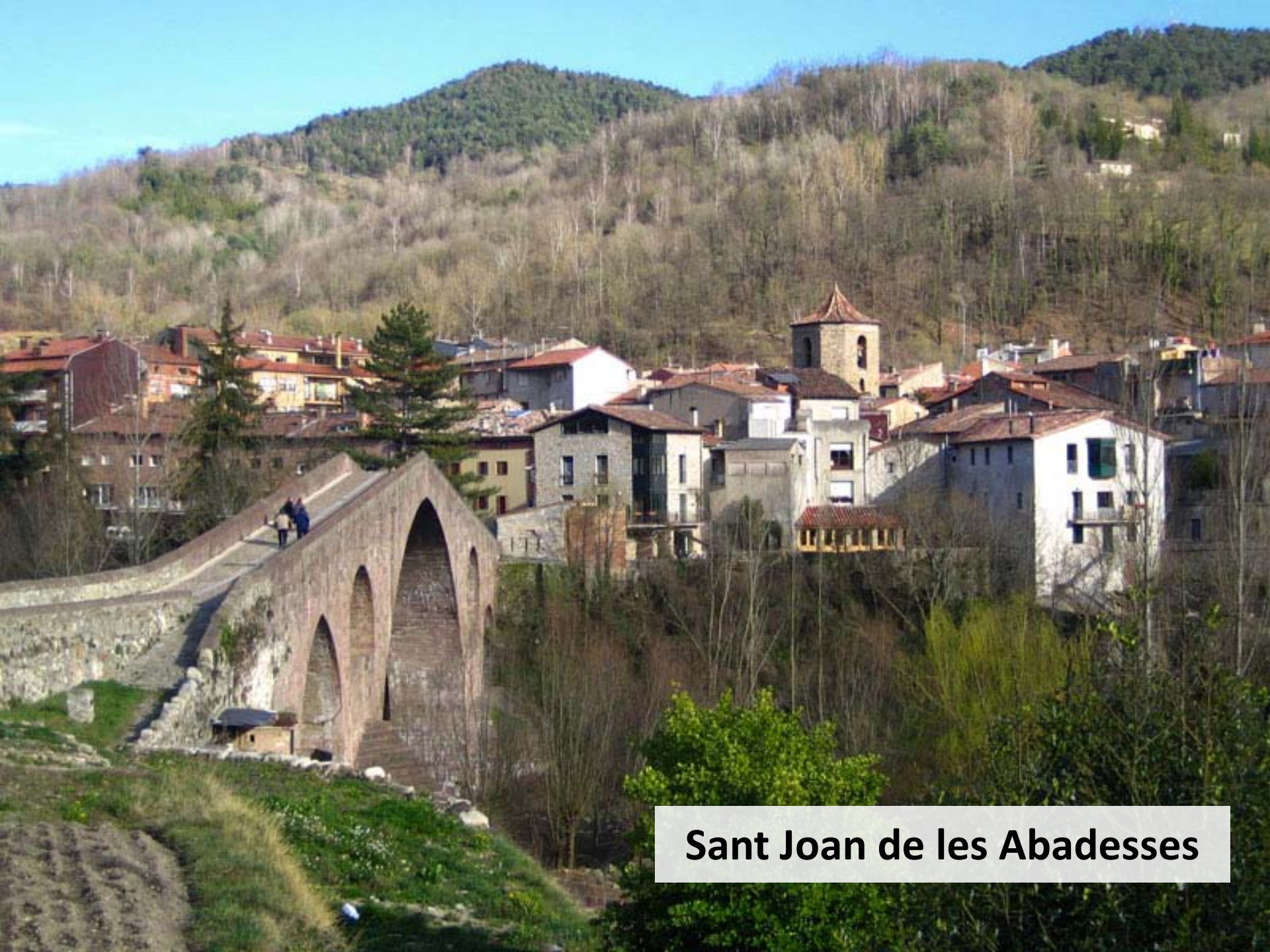
Sant Joan de les Abadesses