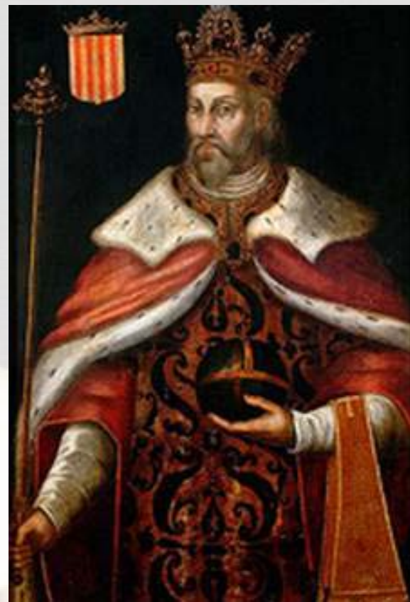
Pere el Gran