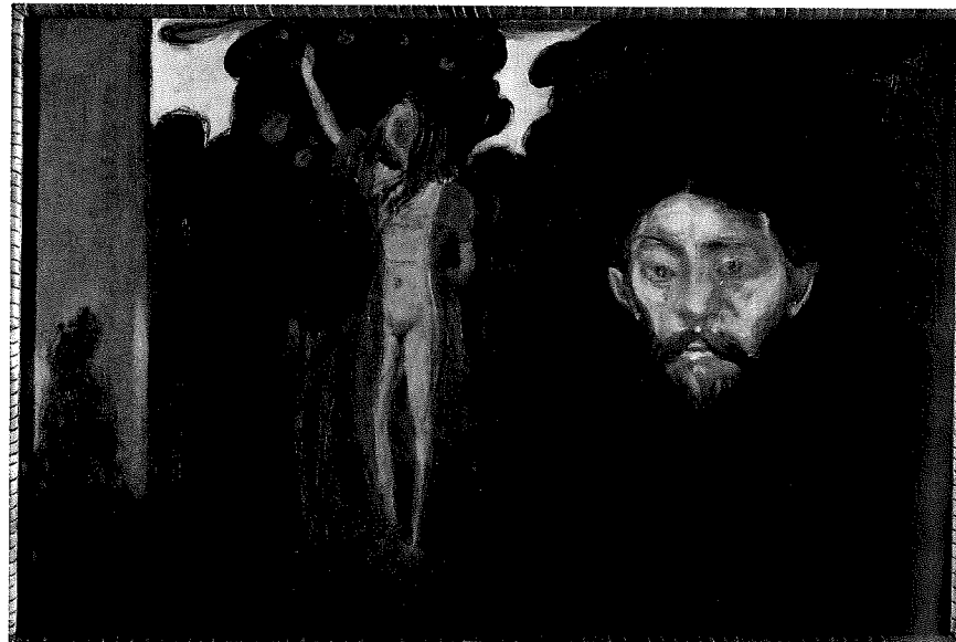
Edvard Munch (1863-1944): Sjalusi (1895)