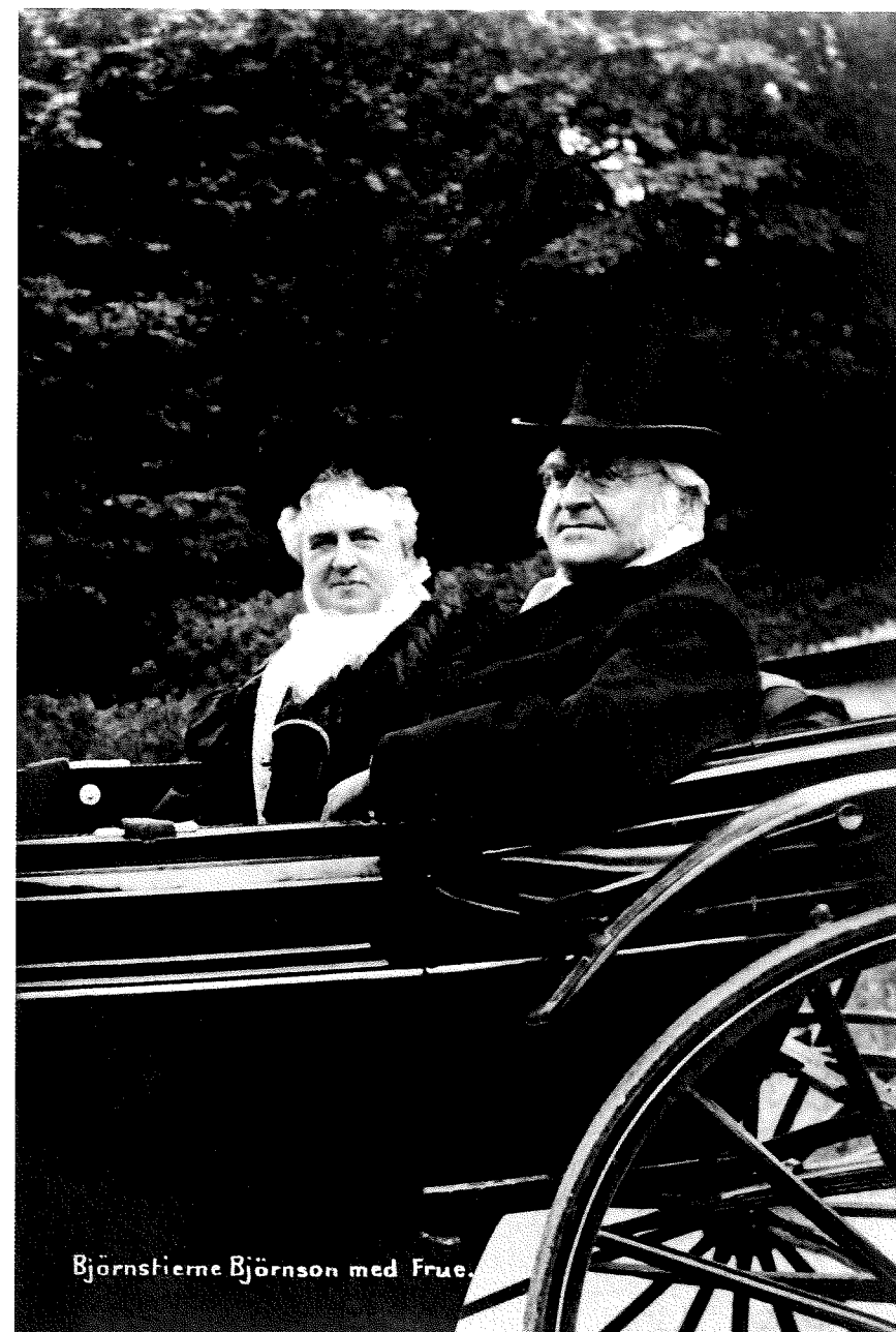
Bjørnstjerne Bjørnson giftet seg med Karoline Reimers i 1858. Her er de fotografert i ca. 1905.

Bjørnstjerne Bjørnson ble født i 1832 på Kvikne, nord for Tynset, og døde i Paris i 1910. Han markerte seg sterkt både som forfatter, samfunnsdebattant, folketaler og teaterpersonlighet. Gjennom sine bondefortellinger, som En glad gut , fornyet han fortellerkunsten i Norge, både når det gjelder form, stil og menneskeskildring. Han grunnla også det moderne sagadramaet og skrev de første realistiske samfunnsdramaene i Norge. Som lyriker var Bjørnson også aktiv, og mange av diktene hans er det satt musikk til. Den norske nasjonalsangen «Ja, vi elsker» er et