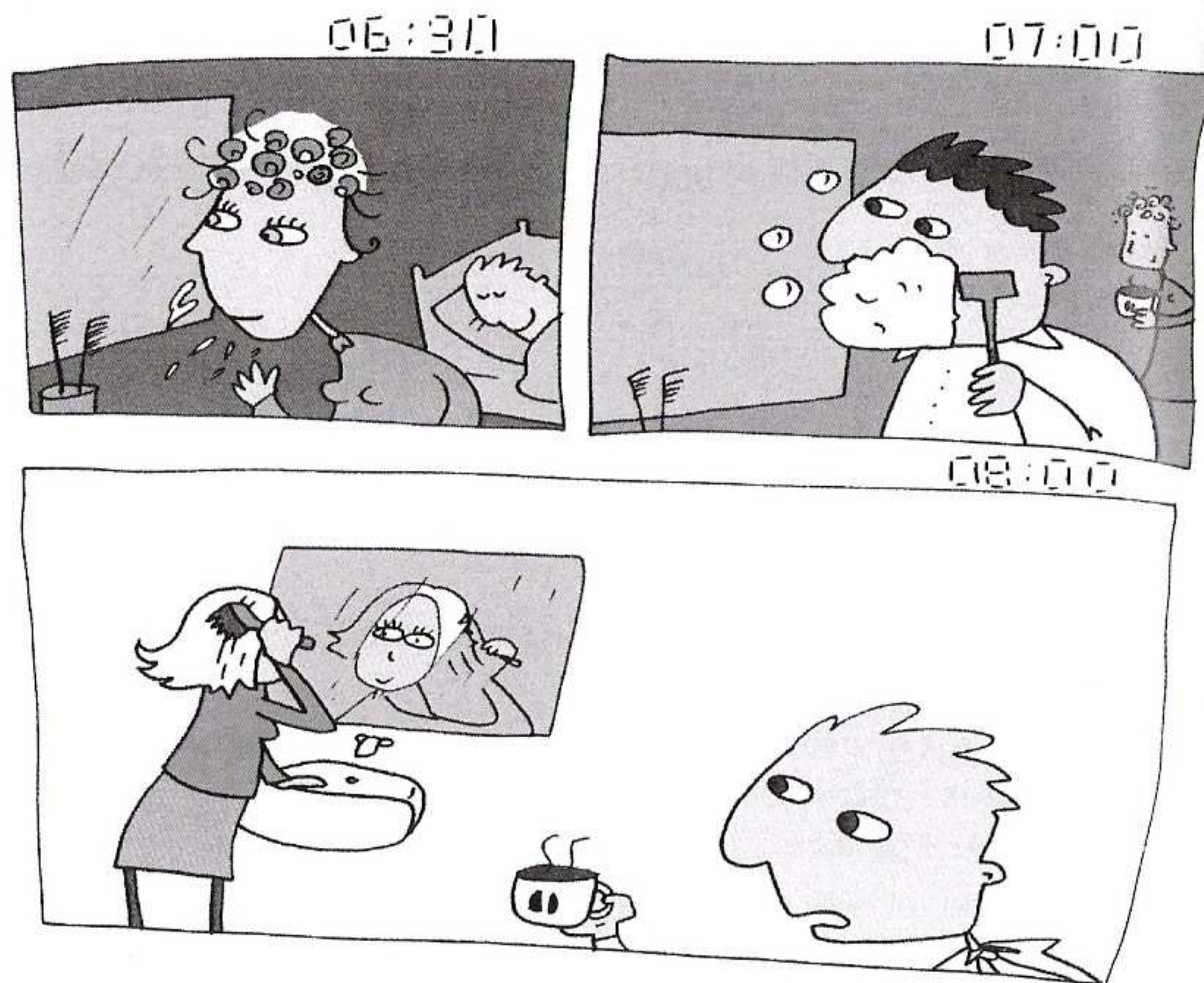
Jutro u obitelji Perić

Gospođa Perić budi se svako jutro već u 6.30. Ide u kupaonicu i umiva se. Odmah zatim ide u kuhinju. Ondje brzo doručkuje i pije kavu. Zatim se opet žuri u kupaonicu, pa se tušira, briše se i pere zube. Onda se dugo šminka, pa se dugo, dugo češlja i pravi frizuru. Kad je gotova, ide u sobu i oblači se za posao. Nikada nije spremna prije 8 sati.