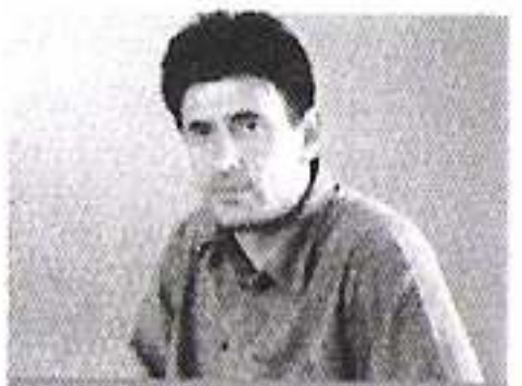
20.15 Da mi je bili morski pas