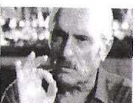
20.00 Grimizno slovo