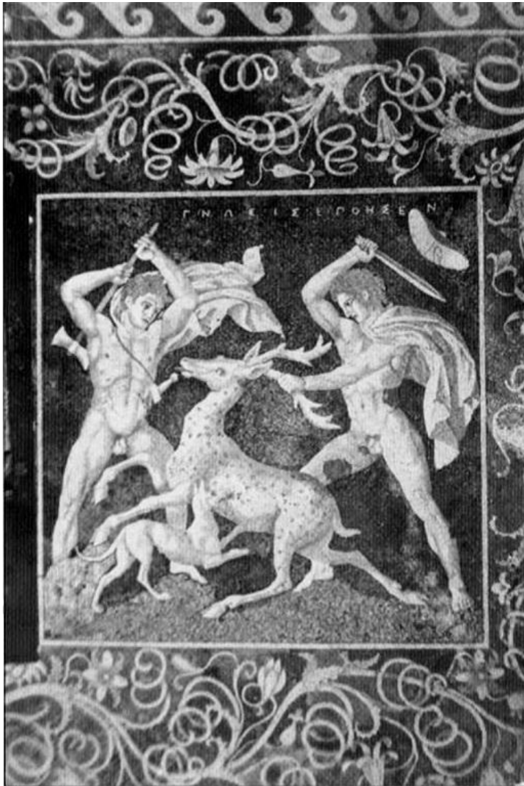
Lov jelena na mozaice z Pelly