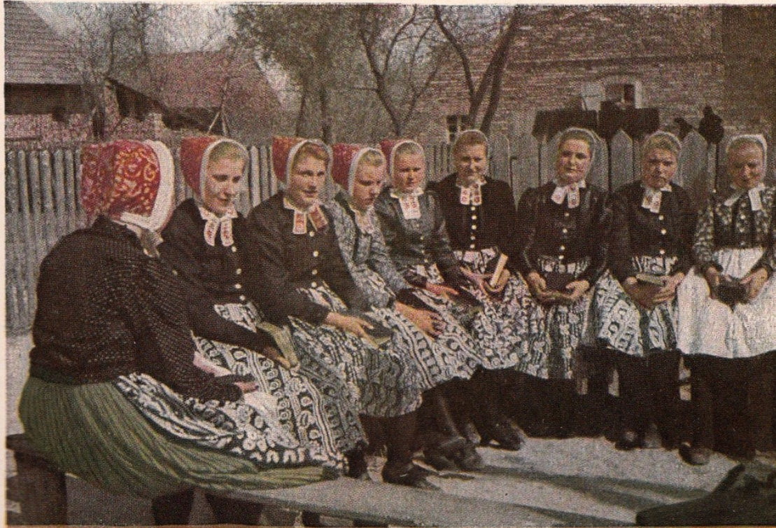
Mädchen auf der Singbank in Rohne bei Schleife