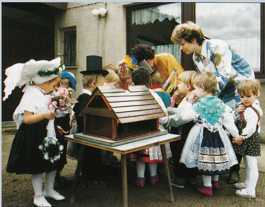
Ptaškowa swajźba w żiśowni w Żyłowje „Ptačí svatba“ ve školce v obci Żyłow/Sielow.