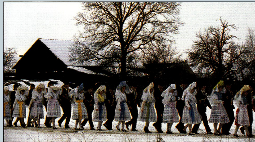
Zapustowy pšesëg we Wjerbnje Masopustní průvod v obci Wjerbno/Werben