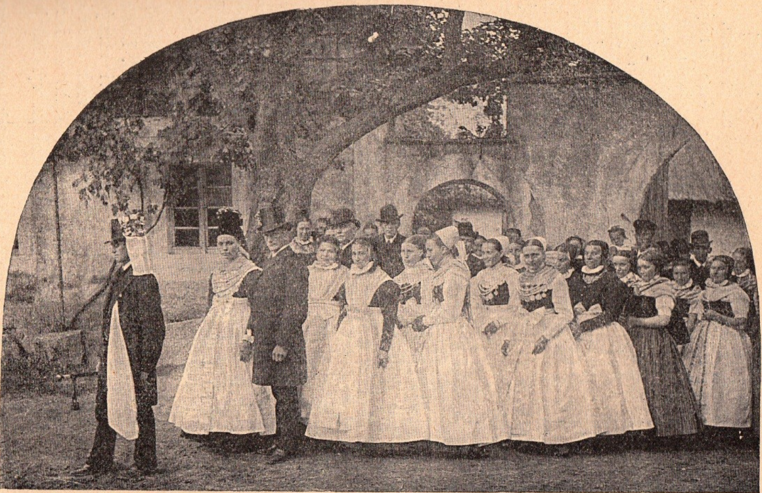
Obr. 21. Svatební průvod z hornoluž. Khejna (katol.). (Braška, nevěsta se ženichem, 2 slonky, 4 družičky, ostat. svatebcané.)