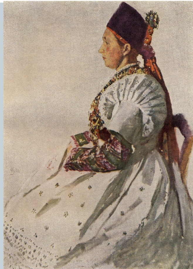
1 — Družíčka nebo svobodná kmotra