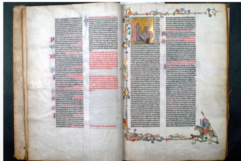
Právní kniha písaře Jana, po roce 1355