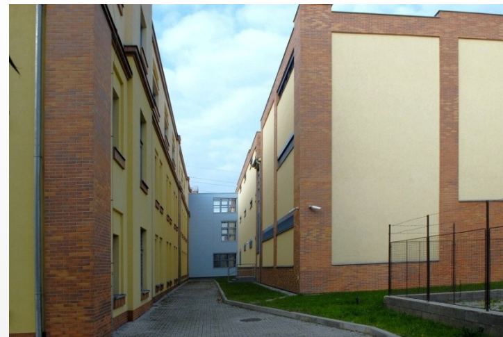
Depozitní budova V provozu od roku 2005