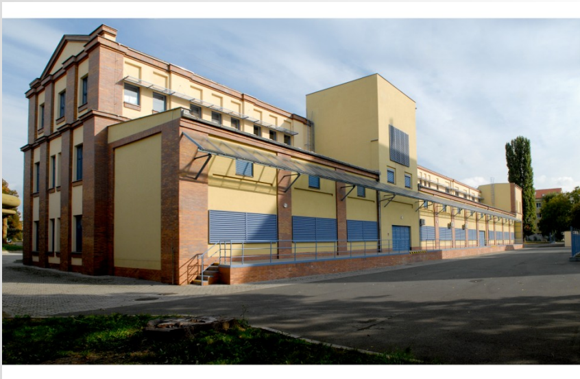
Pohled od železniční dráhy Rekonstrukce z roku 2002