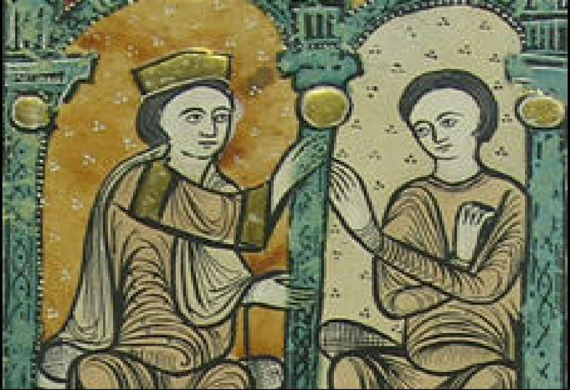
Ramon Berenguer I a Almodis de la Marca