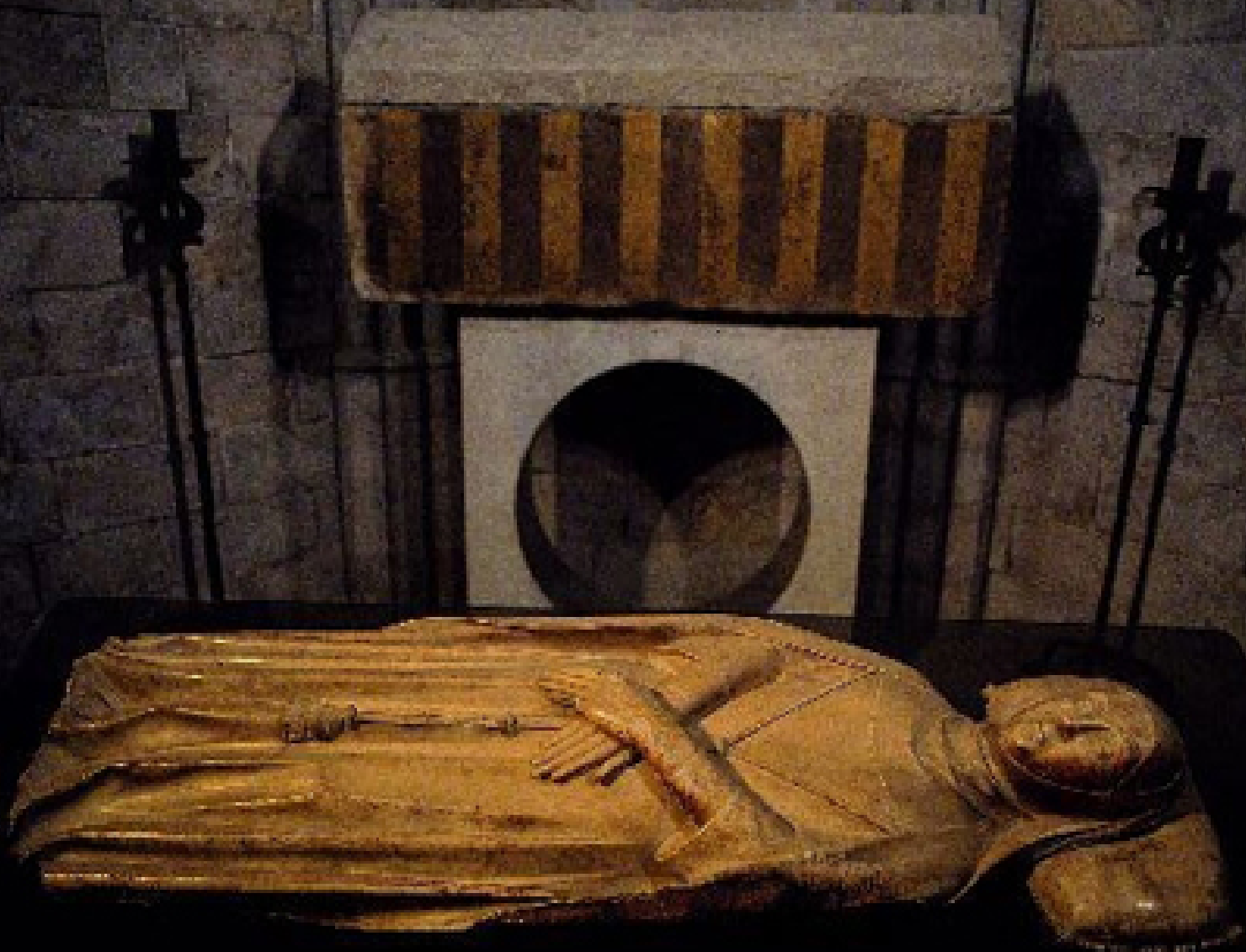
Ermessenda de Carcassona – hrobka v katedrále v Gironě