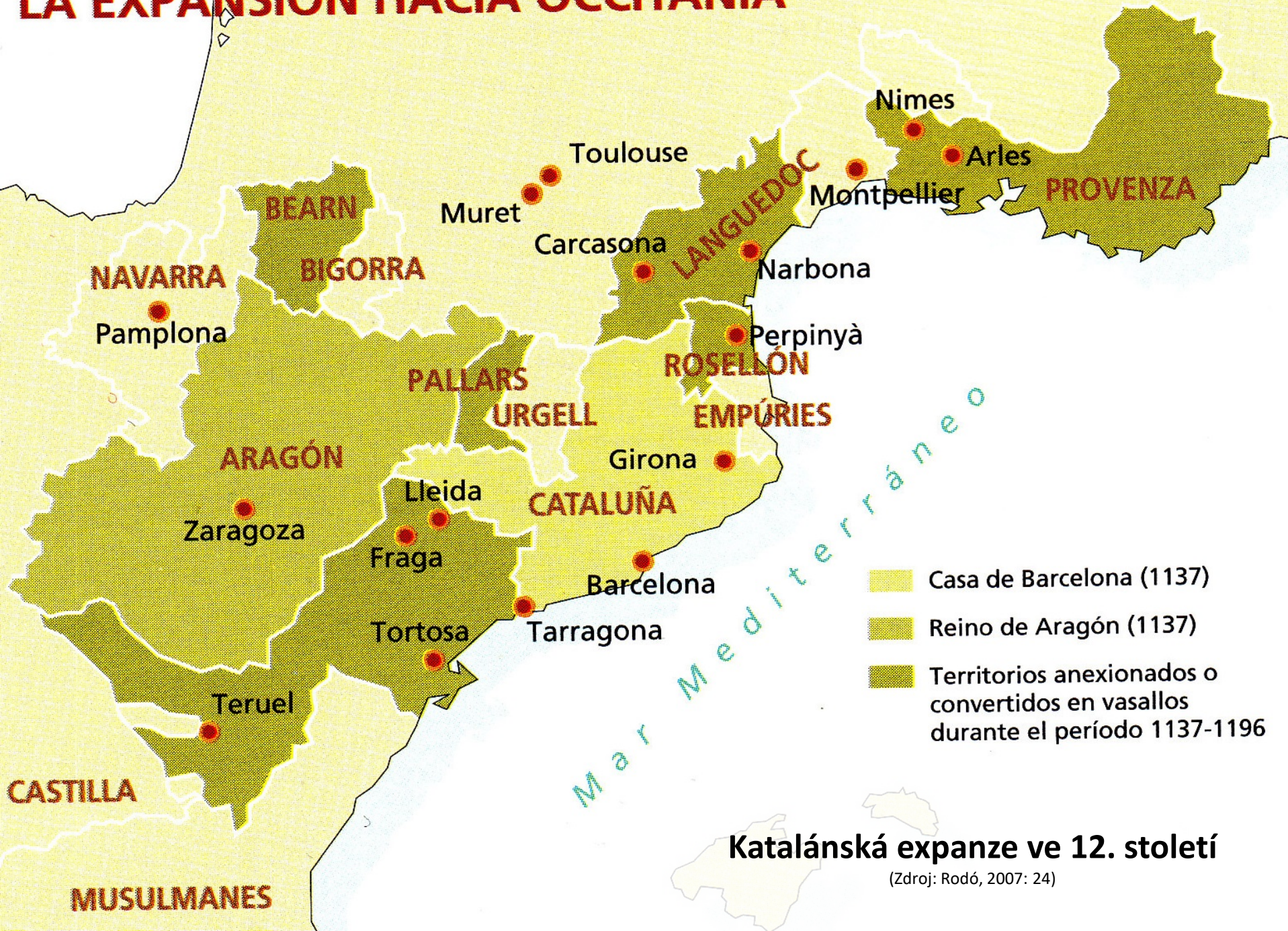
Katalánská expanze ve 12. století