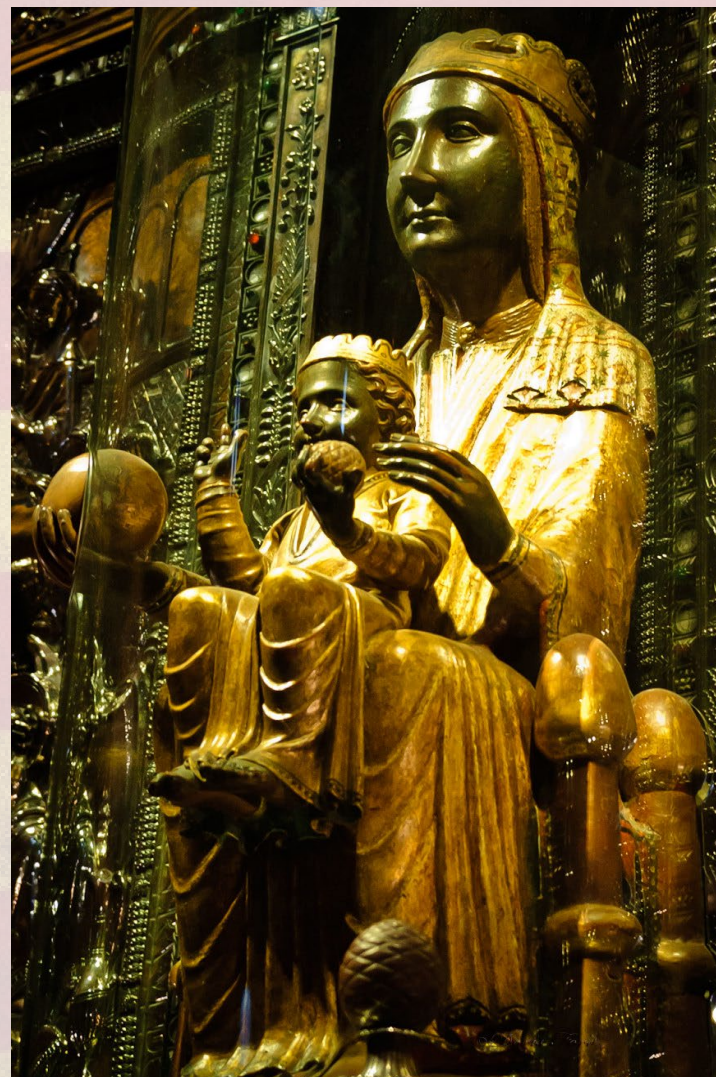
La Moreneta (klášter Montserrat) – černá madona, soška z 12. stol. Jeden ze symbolů Katalánska