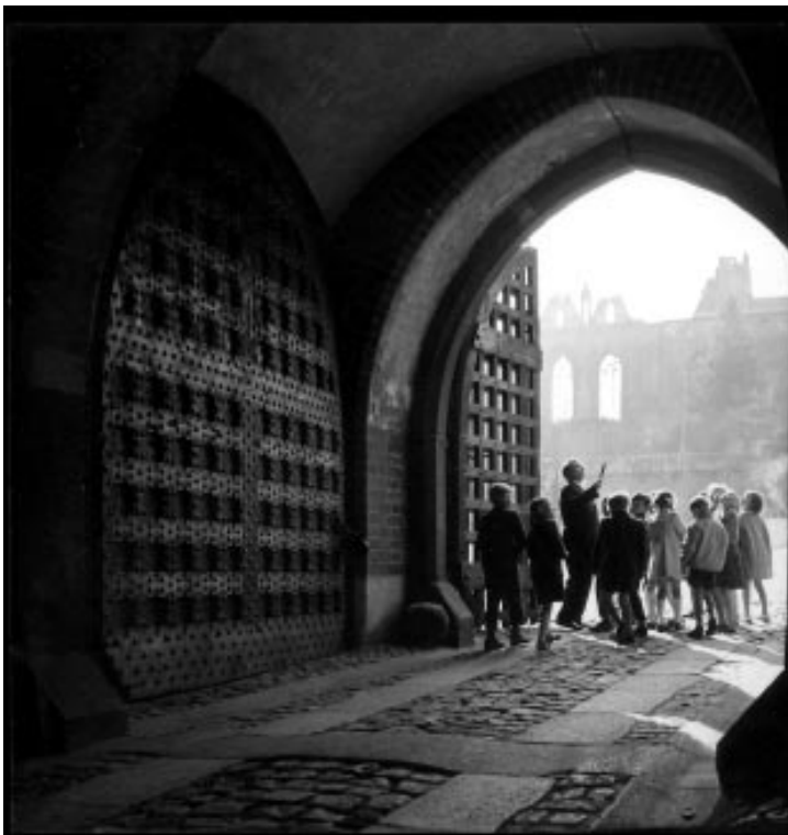
KAZIMIERZ LELEWICZ W Gdańsku . Fotografia z lat pięćdziesiątych