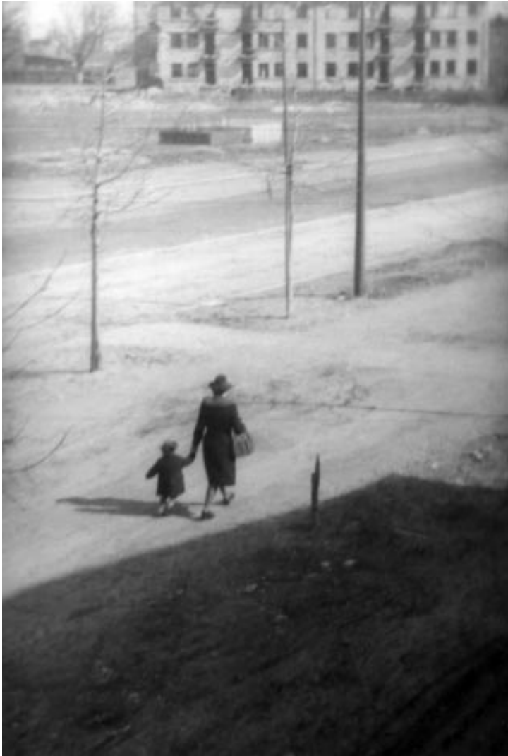
STANISŁAW HUECKEL W „ nowym domu ”, Wrzeszcz 1946