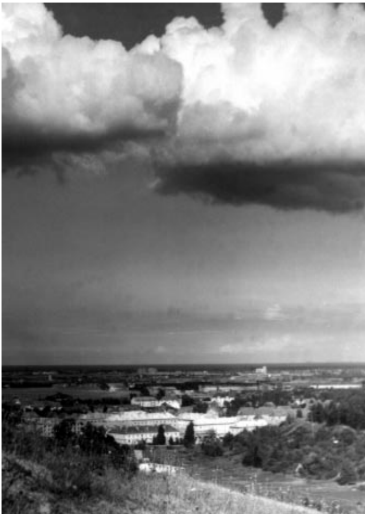
EMIL KRESAK Daleki widok . Fragment, Wrzeszcz 1953