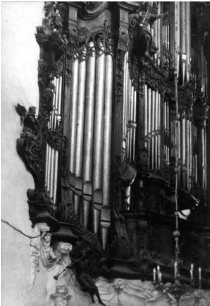
KAZIMIERZ LELEWICZ Organy w Katedrze Oliwskiej . Fotografia z lat pięćdziesiątych