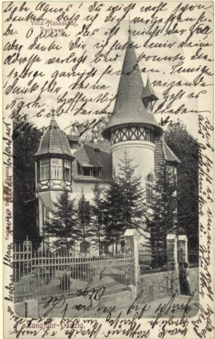
Villa Henkenhaf, Wrzeszcz. Pocztaówka z roku 1900