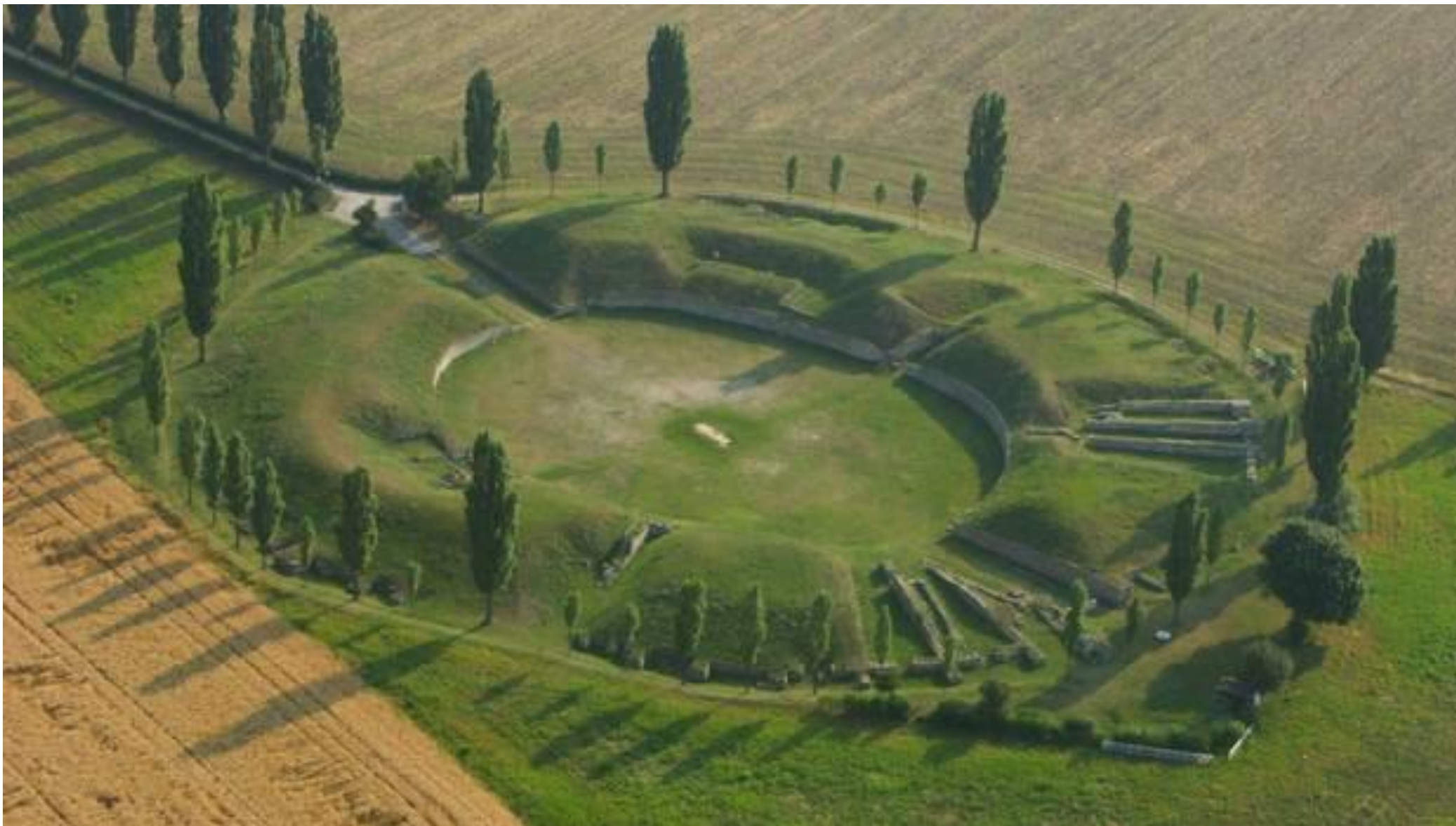
Římský amfiteátr, Carnuntum (Rakousko)