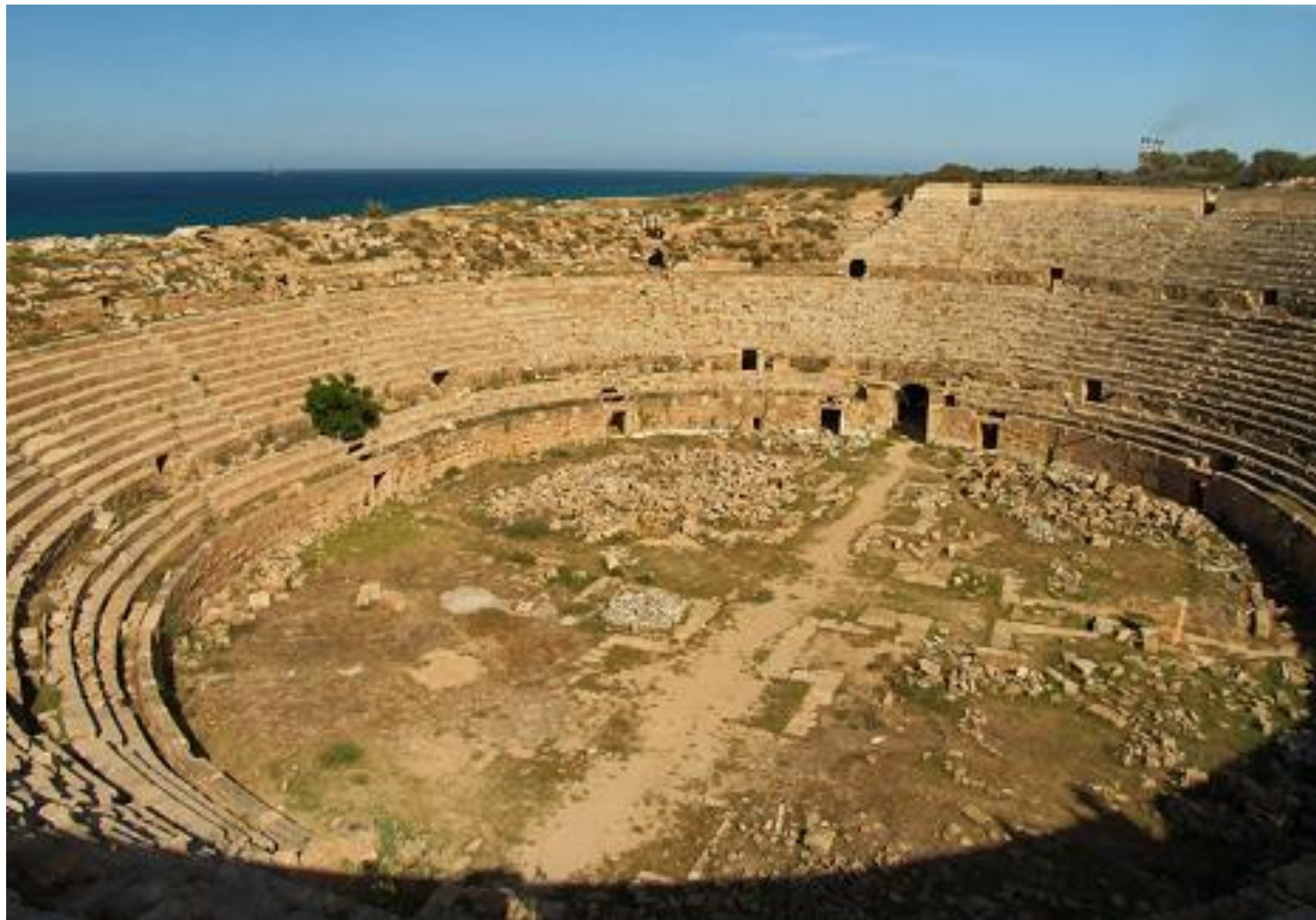
Římský amfiteátr v Leptis Magna, Libye