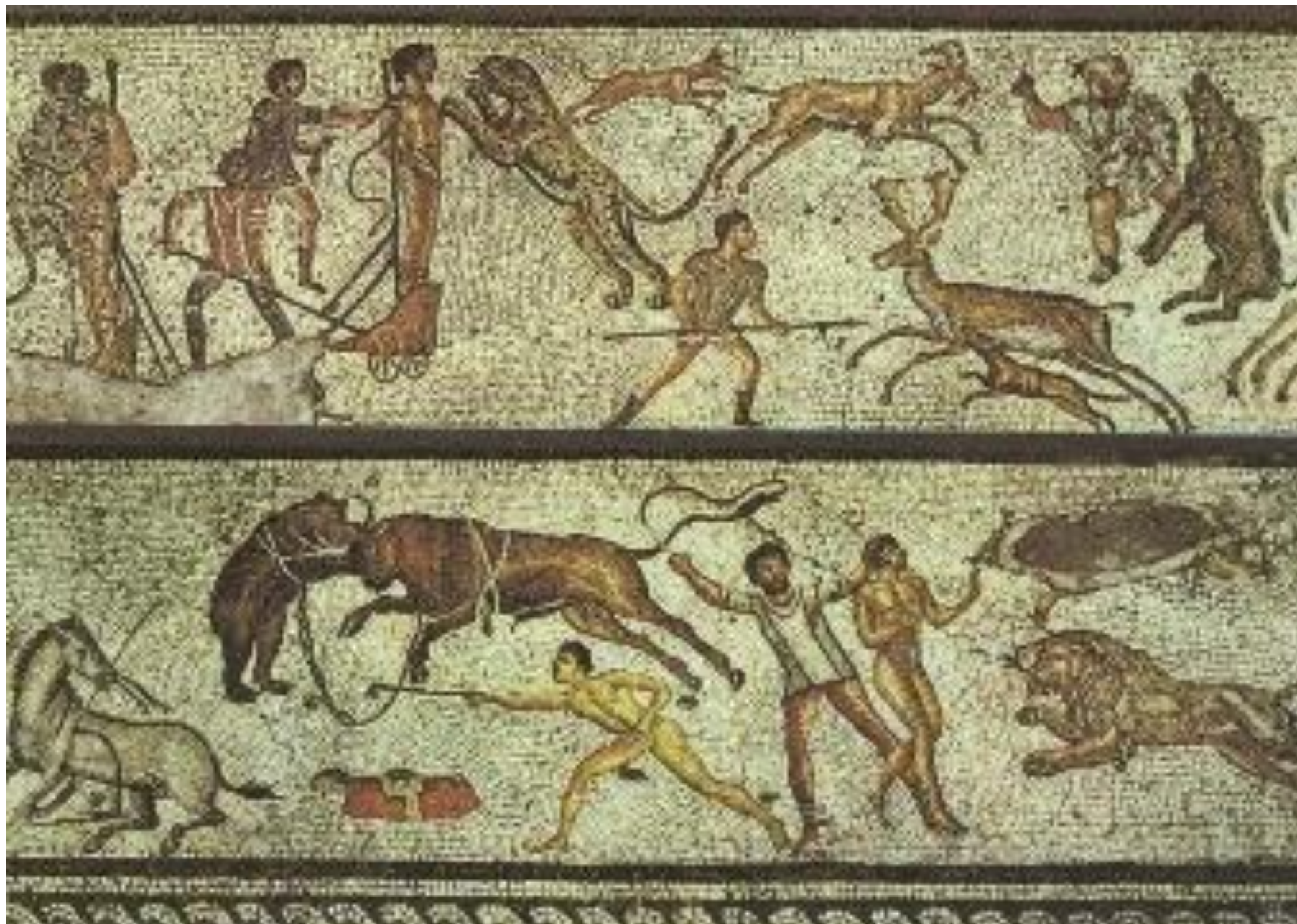
Mozaika z vily v Dar Buc Ammera, Zliten v Libyi