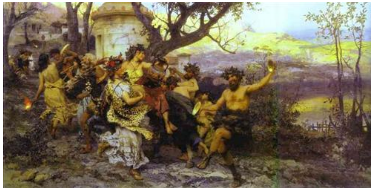
Henryk Siemiradzki (1843- 1902)