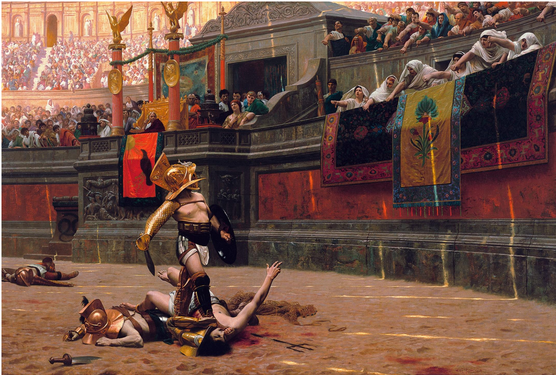
Jean Léon Gérôme (1824-1904)