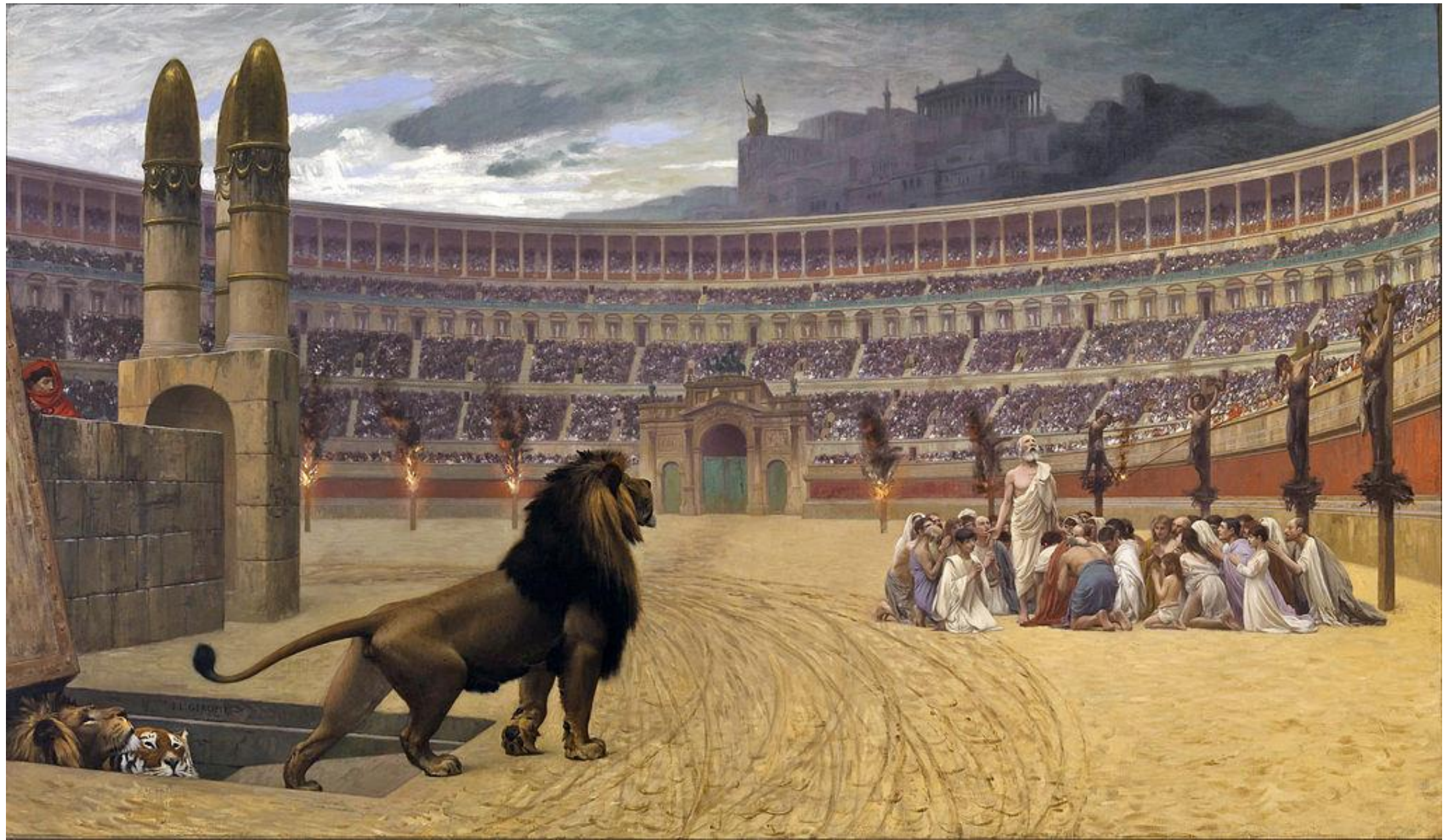
Jean Léon Gérôme (1824-1904)