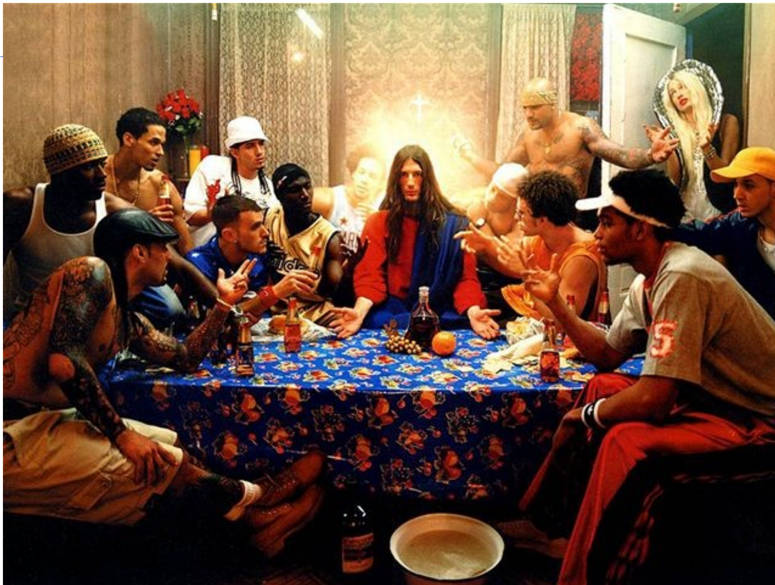
David LaChapelle: Poslední večeře, 2003