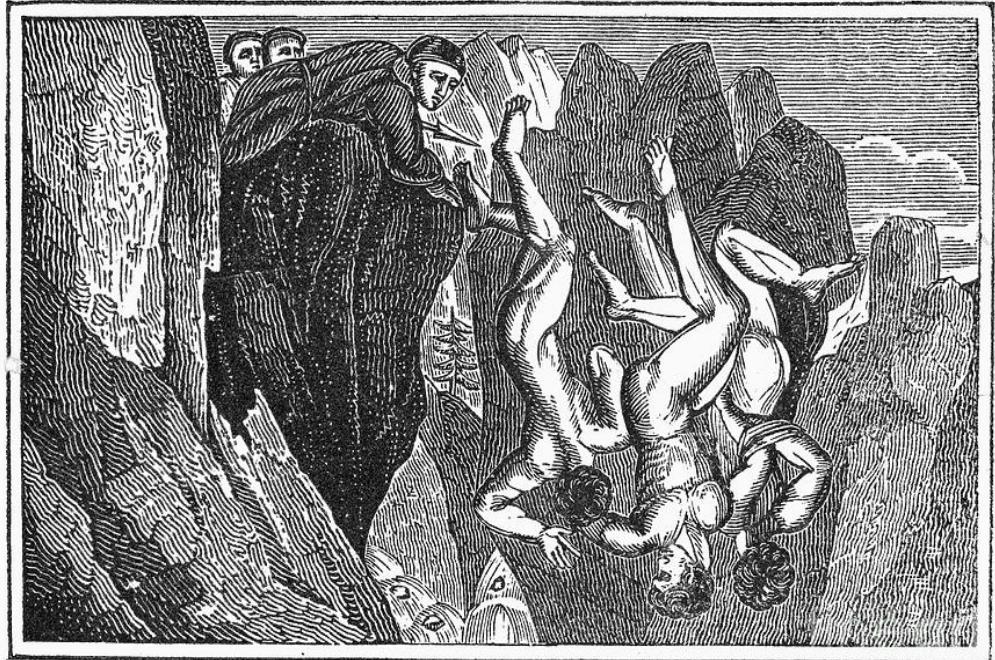
Persecution of the Waldenses.