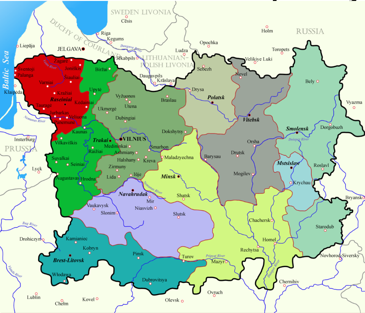
LITHUANIA AND ITS ADMINISTRATIVE DIVISIONS (1654)