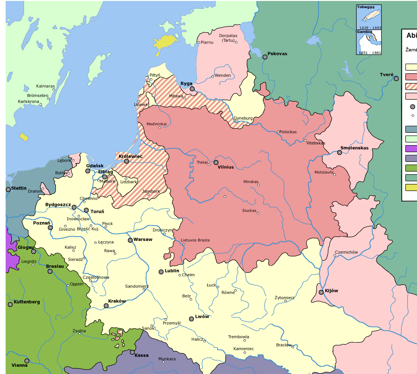
Tobago 1639 - 1693 Gambia 1651 - 1661