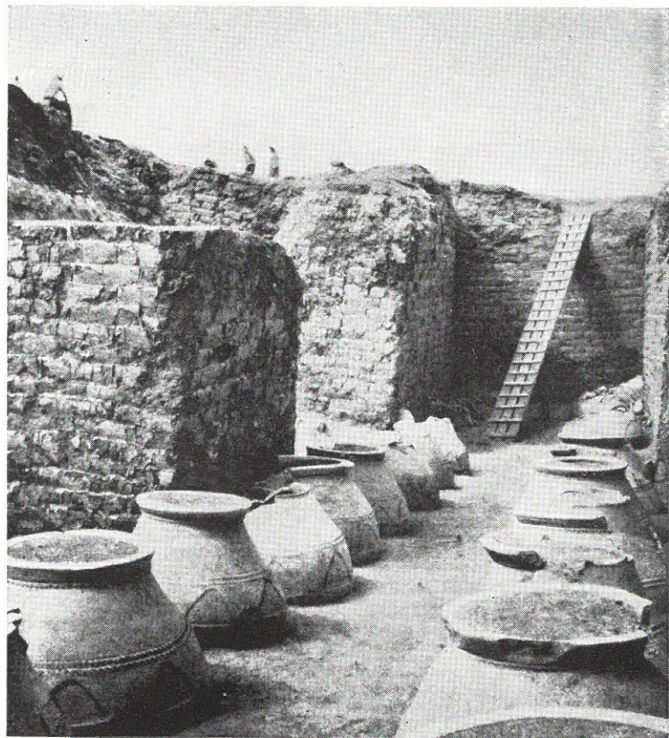
XXIV. Ze sovětských archeologických objevů v Ukartu. Sín vládařského paláce s nádobami na víno v Tejše-baini (dnešní Karmir-blur).

ništusova, se dovídáme přesnější čísla o ceně půdy, kupované tímto vladařem od občin. Tato hodnota byla vyjadřována jak v obilí, tak i ve stříbře, s uvedením přepočítacího kursu v poměru 1 kur obilí (tj. asi 121 litrů) za 1 šekel stříbra. Při nákupu movitostí byla cena uvedena toliko ve stříbře.