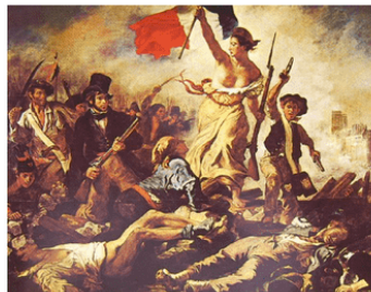
E. DELACROIX, La libertà che guida il popolo , 1830

E' una delle opere più note dell'artista. La libertà che guida il popolo nasce in relazione ai moti rivoluzionari del luglio 1830, che rovesciarono il regno di Carlo X in soli tre giorni. La tela è dominata dall'impeto travolgente del popolo che avanza e che nessuna forza reazionaria potrà arrestare. E', questo, un quadro nel quale è rappresentata con chiarezza l'ideologia liberale dei giovani romantici.