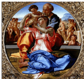
M. BUONARROTI, Sacra Famiglia , 1504