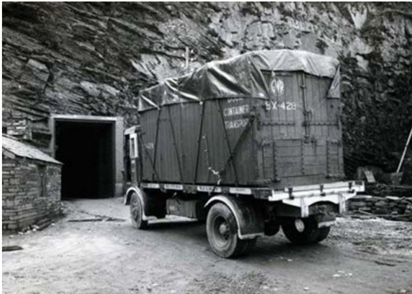
1941, National Gallery, British Museum