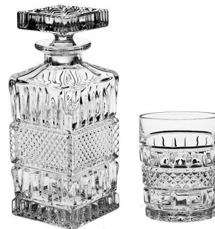
Bohemia Crystal, min. 24 % PbO – Křišťálové sklo