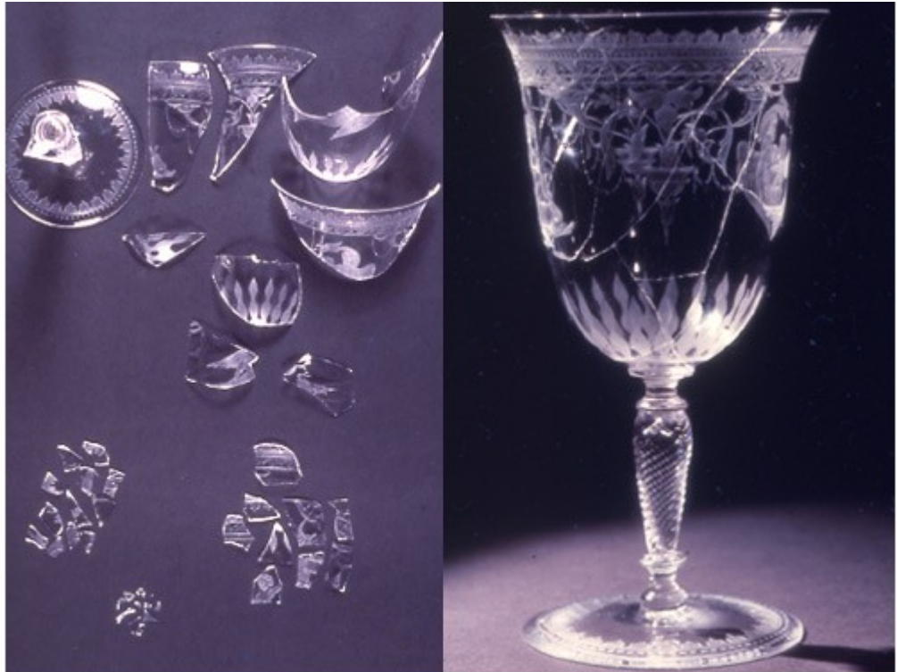
Skleněná číše, 1862, Victoria and Albert Museum

Renesanční skleněná láhev (17. - 1. pol. 18. století) – stav po restaurování, Středočeské muzeum v Roztokách u Prahy