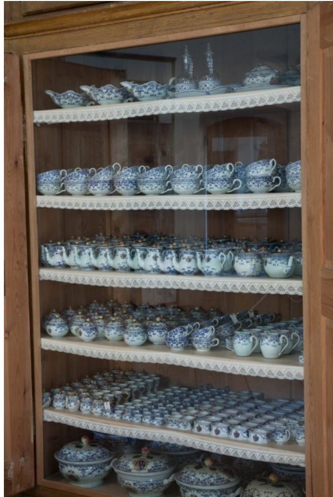
Interiér cukrárny, SZ Hluboká, NPÚ