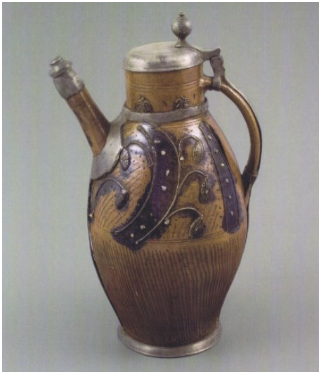
Solná glazura (hnědo-oranžová), Dolní Lužice, konce 18. stol.