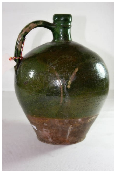
Džbán s olovnatou glazurou, poč. 20. stol., Galerie Karoline