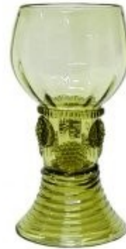
Replika zeleného středověkého skla