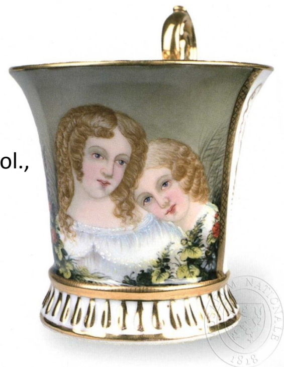
Porcelán – malovaný emailem, 19. stol., NM