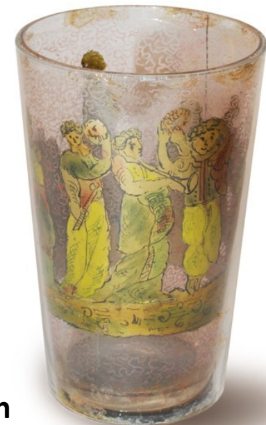
Pohárek z čirého foukaného skla, který je sestaven ze dvou kalíšků jako tzv. dvojstěnka, 1714, Sběrka Muzea Vysočiny Havlíčkův Brod