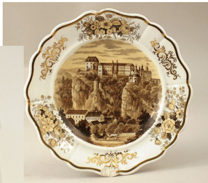
Kamenina ze sbírek UPM