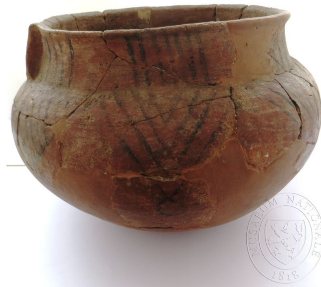
Doba halštatská, NM