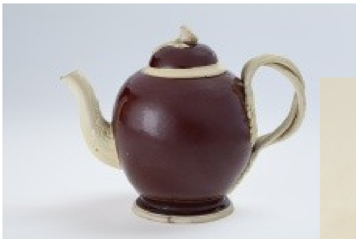
Kamenina z Proskova, Slezské zem. muzeum