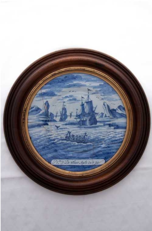
Fajánsový talíř, Metodika NPÚ

Fajáns je pórovitá keramika s jemným bělavým, nažloutlým až našedlým střepelem s neprůhlednou bělavou olovnatocíníčitou glazurou. Název vznikl podle italského města Faenza, později se tento typ keramiky v zaalpských zemích nazývala fayence. Teplota výpalu je obdobná jako u majoliky.