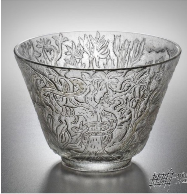
Leptané sklo, Městské muzeum v Železném Brodě

Uranové sklo – barvené sloučeninami uranu, od pol. 19. stol., v UV světle fluoreskuje; https://danatenzler.blog.idnes.cz/blog.aspx?c=545595