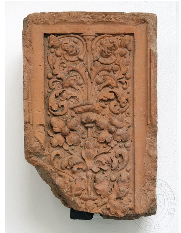
Architektonický článek, 16. stol., NM