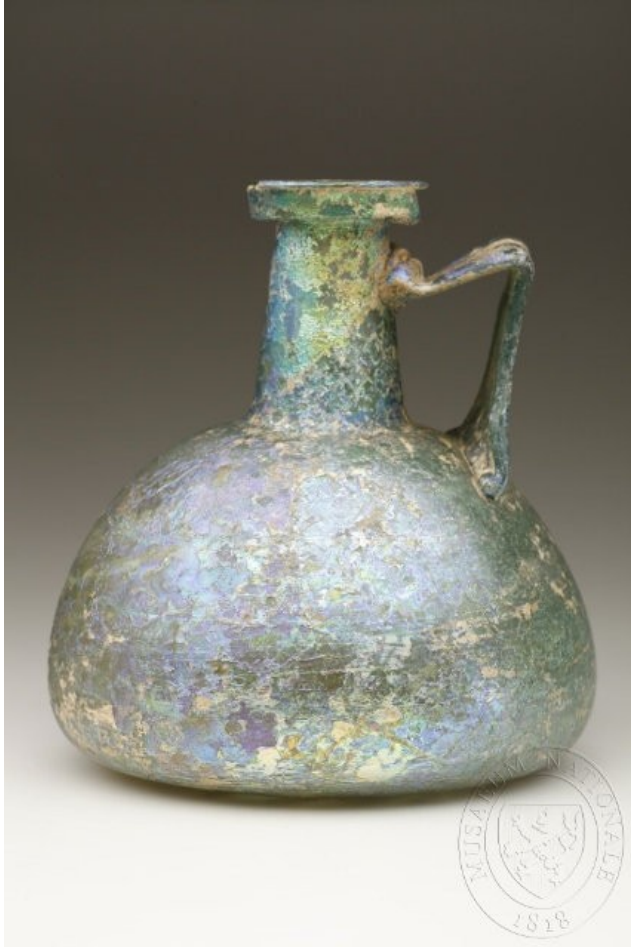
1. – 2. stol. , NM, e-sbírky

Vytvářené irizující vrstvy, zakalení povrchu, odlupování – důsledek půdní koroze u archeologického skla: