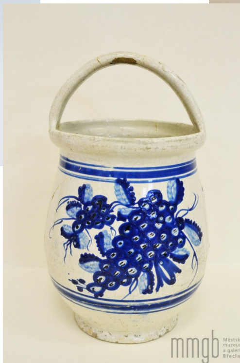
Kamenina, 19. stol., Muzeum Břeclav