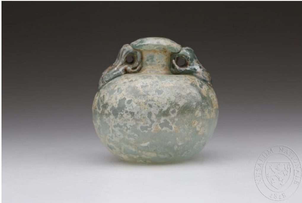
Antické sklo, 1, stol., NM