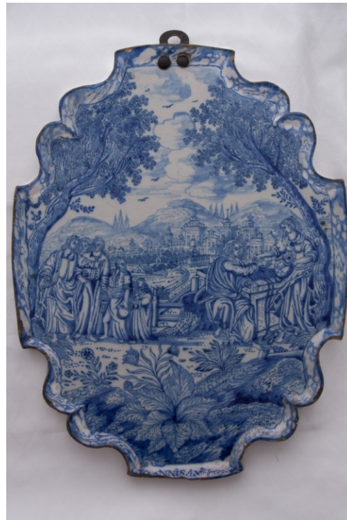
Záběr na fajánsovou desku poč. 18. Století, SZ Hluboká