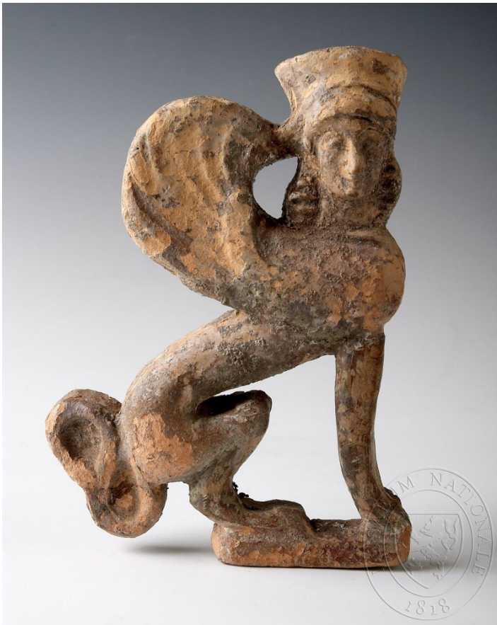
Terakota, 5. stol. př. n. l., NM