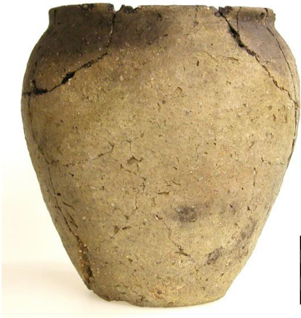
Slovanská keramika, L. Svobodová, AÚ Praha, 500 – 700 n. l.