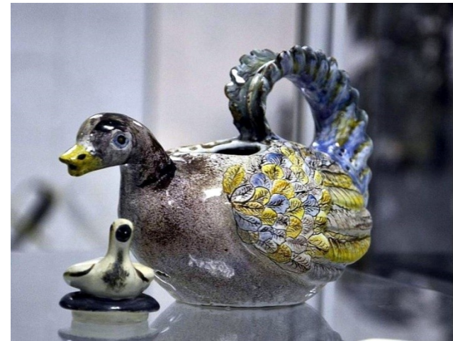
Kachna, fajáns, 60.–70. léta 18. století. Moravské galerie v Brně.