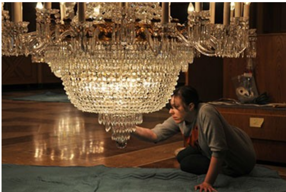
Lustr, 1844, olovnaté sklo, CCI Notes, Caring for ceramics and glass objects