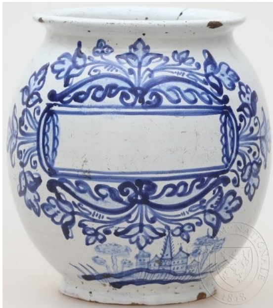
Majolika, habánská fajáns, 17. stol. NM