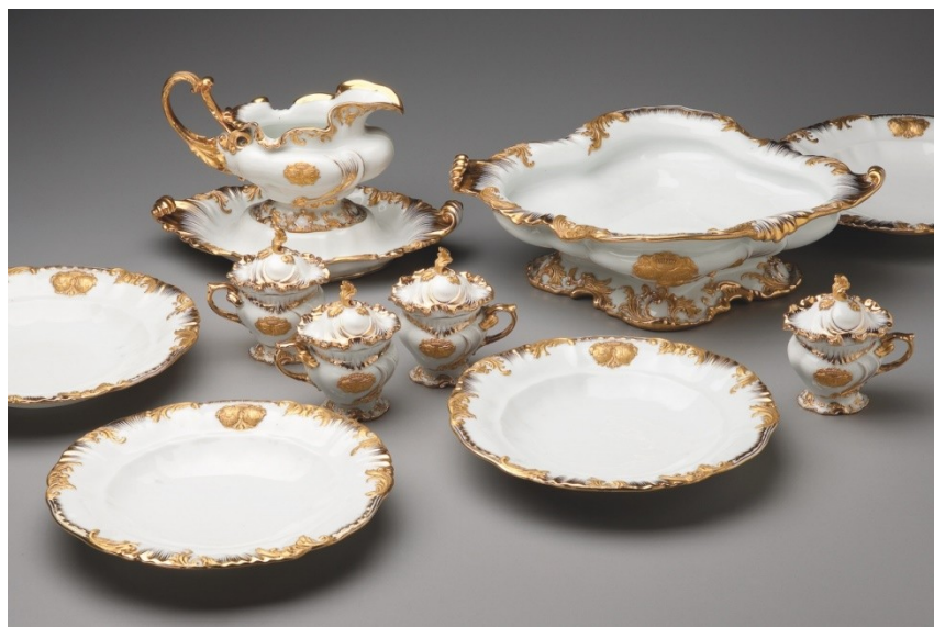
Muzeum českého porcelánu, Zámek Klášterec nad Ohří, ze sbírek UPM