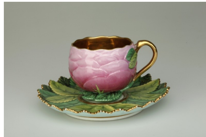
Zlacený porcelán, 19. stol., NM

Porcelán je označení pro materiál, který je slinutý bílý a v tenké vrstvě průsvitný. Nepropouští vodu ani plyny. Vyrábí se z jemně mleté směsi kaolínu, křemene a živce. Měkké porcelány mají teplotu výpalu mezi 1280–1300 °C.