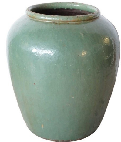
Seladonová glazura (zelenká) na čínské kamenině, 19. stol.