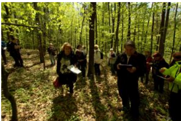
34 - ŠLP - Bílovice nad Svitavou