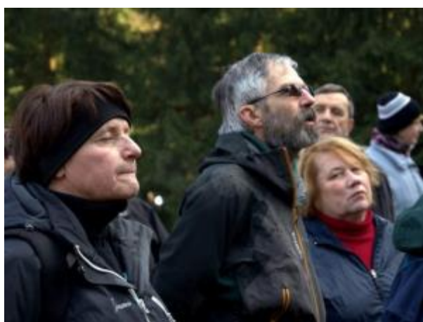
28 - ŠLP - Arboretum Řícmanice