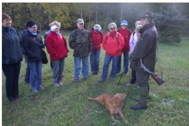
29 - ŠLP - Bažantnice Rajhrad