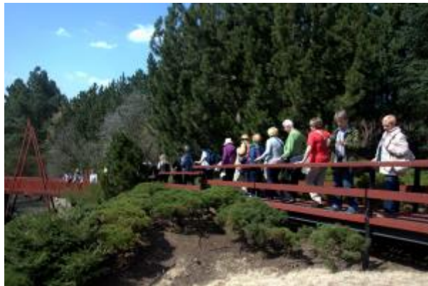
31 - Arboretum MENDELU Brno