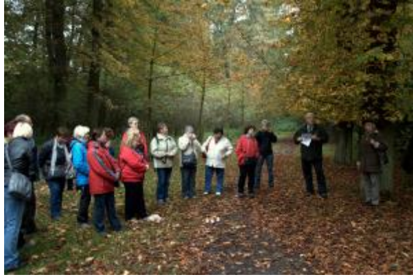
30 - ŠLP - Obora Sokolnice