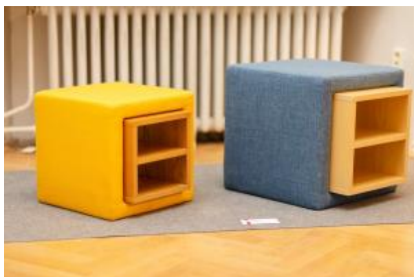
2 - Design nábytku