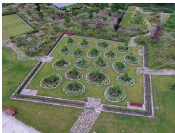
12 - Areál Zahradnické fakulty v Lednici - Tematické zahrady