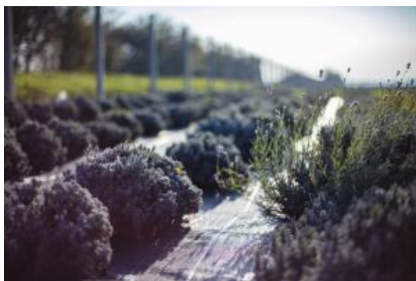
8 - Areál Zahradnické fakulty v Lednici