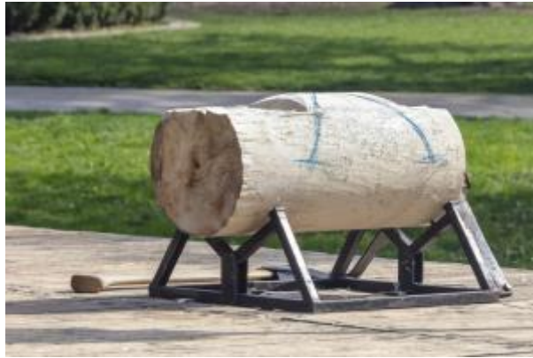
4 - Lesnická všestrannost