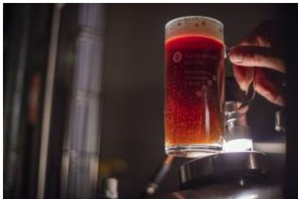
15 - Výroba piva