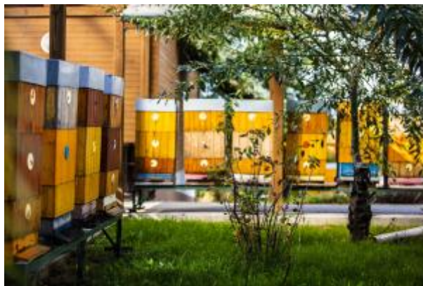
14 - Včelařství