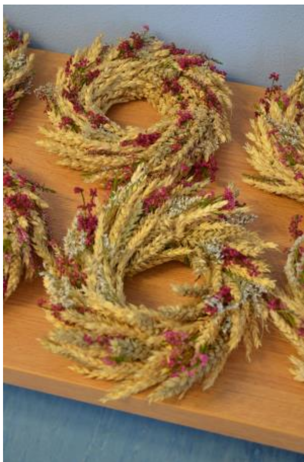
26 - Praktické semináře floristiky a aranžování