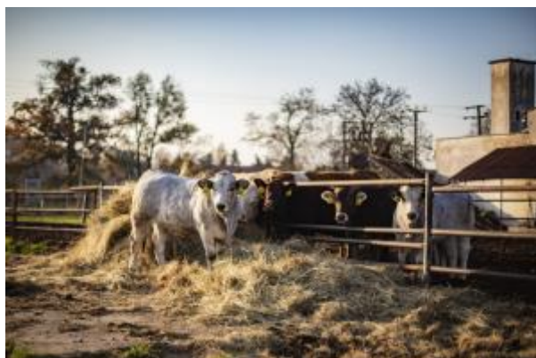
17 - ŠZP - Žabčice