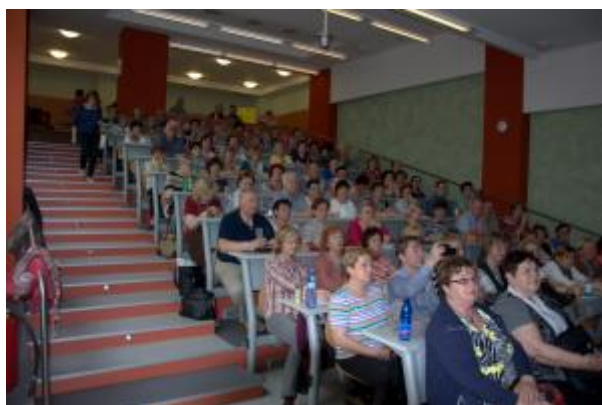
22 - Přednášky v posluchárnách ICV MENDELU