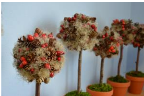
25 - Praktické semináře floristiky a aranžování