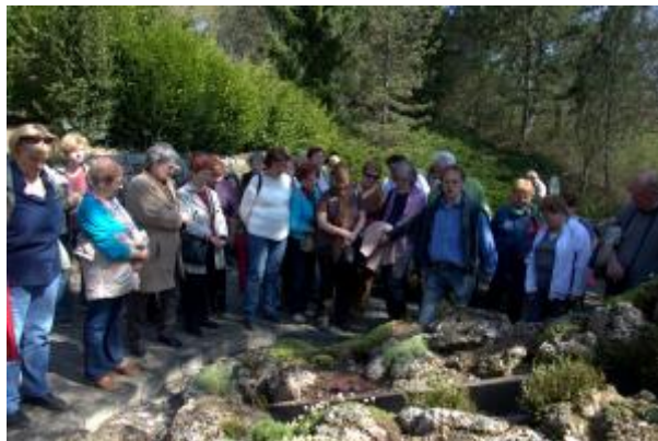
32 - Arboretum MENDELU Brno