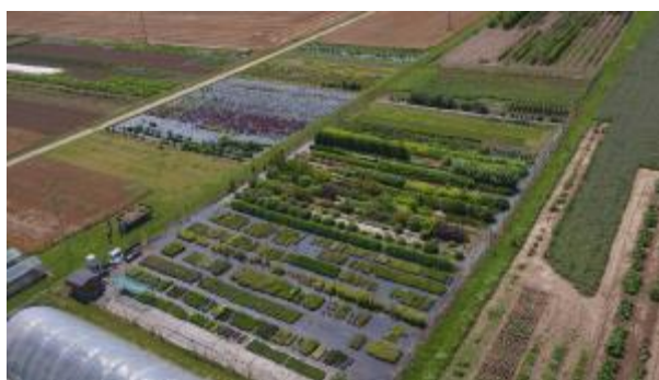
10 - Areál Zahradnické fakulty v Lednici