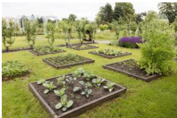
7 - Areál Zahradnické fakulty v Lednici