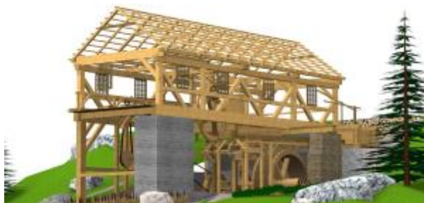
6 - Dřevostavby