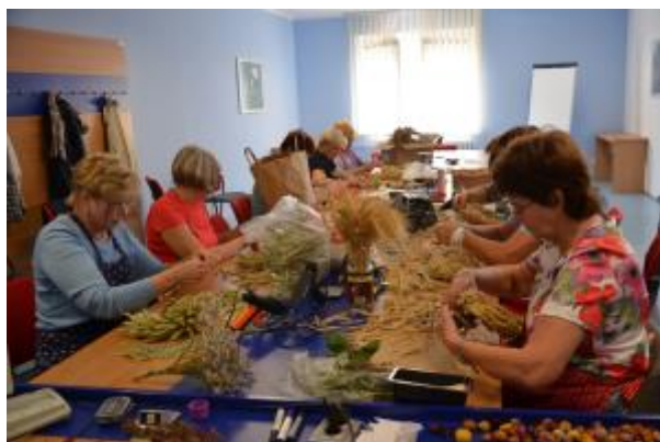
24 - Praktické semináře floristiky a aranžování