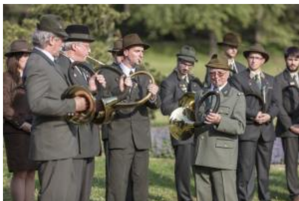
3 - Trubači LdF MENDELU