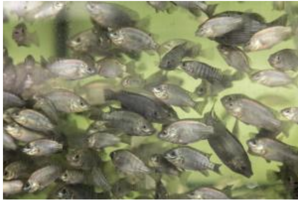
13 - Ústav rybářství