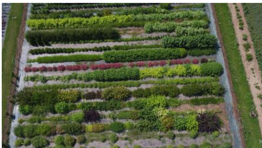
9 - Areál Zahradnické fakulty v Lednici