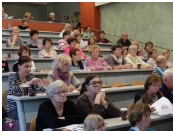
21 - Přednášky v posluchárnách ICV MENDELU