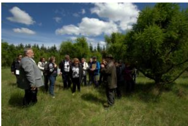
35 - ŠLP - Bílovice nad Svitavou