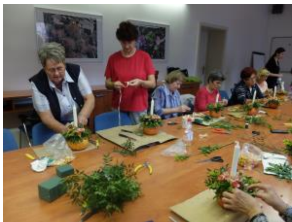
23 - Praktické semináře floristiky a aranžování