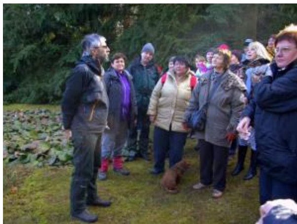
27 - ŠLP - Arboretum Řícmanice