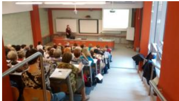
20 - Přednášky v posluchárnách ICV MENDELU