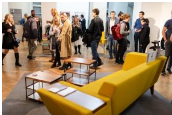
1 - Design nábytku