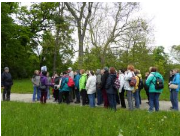
36 - Zahradnická fakulta Lednice - Tématické zahrady