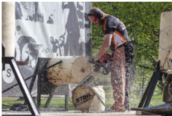
5 - Lesnická všestrannost